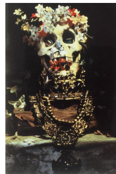
Cindy Sherman, Sans titre , photographie de 1992

La fuite du temps est souvent figurée par le chronomètre, la montre, la clepsydre, la bougie consumée, le sablier ou la lampe à huile.