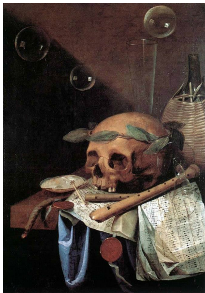
Simon Renard de Saint-André, Vanité , huile sur toile, 1650, Lyon.