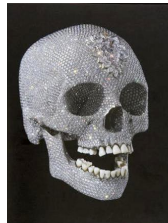
Damien Hirst, For the love of God , 2007, réplique en platine d'un crâne du 18ème siècle incrusté de 8601 diamants et estimé à 100 millions de dollars !!