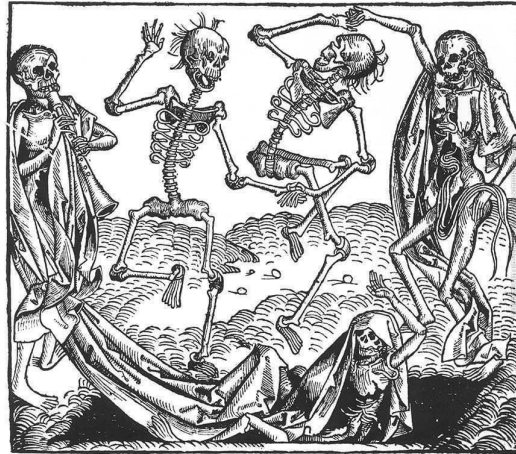
The dance of death , 1493, Michael Wolgemut, issu de Liber chronicarum .