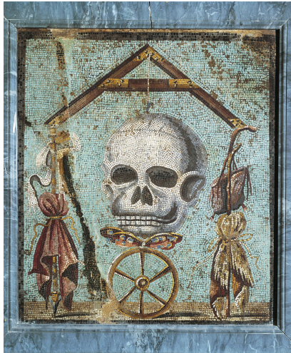
Mosaïque polychrome trouvée à Pompéi, Tête de mort avec les attributs du mendiant et du roi , vers 79 av.J-C