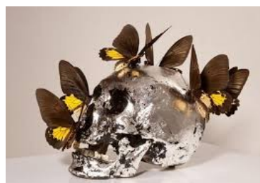
Philippe Pasqua, Crâne aux papillons , os, feuilles d'argent et papillons, 2006