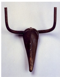
Pablo Picasso, Tête de taureau, 1942, assemblage d'un guidon de vélo et d'une selle.