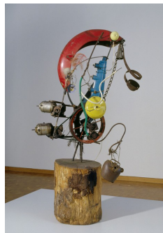
Jean Tinguely, Balouba, 1961 : différents objets et matériaux assemblés pour composer une sculpture d'animal étrange.