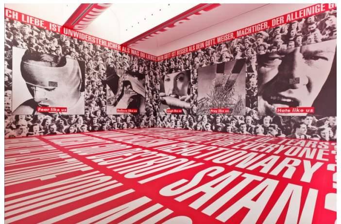
Sans titre, Barbara Kruger, 1994-1995 et 2014-2015, Sérigraphies de photographies, dimensions variables. Musée Ludwig, Cologne, Allemagne

Marcel Duchamp, Le Fil (Mile of String), 1942, installation dès le vernissage de l'Exposition First Papers of Surrealism, New-York, octobre-novembre 1942. → spectateur contraint par des dispositifs spatiaux, environnement sensoriel (visuel) nouveau, et donc déstabilisant pour le spectateur