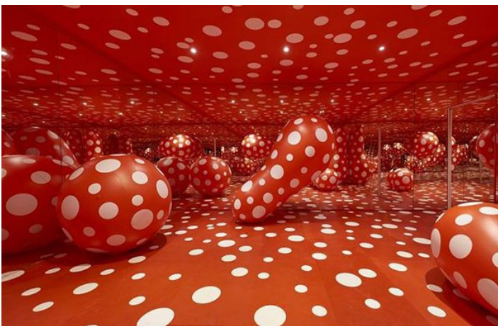
Yayoi Kusama, Dots Obsession, 1998, peinture, miroirs, ballons, adhésifs et air, 280 × 600 × 600 cm, inv. : 1999.2.7. Collection les Abattoirs, Musée - Frac Occitanie Toulouse.

Parmiggiani, Luce, luce, luce, 1968, pigment pur jaune Cadmium, Collection de l'artiste, en dépôt au MAMCO, Genève → environnement sensoriel unique, déstabilisation du spectateur