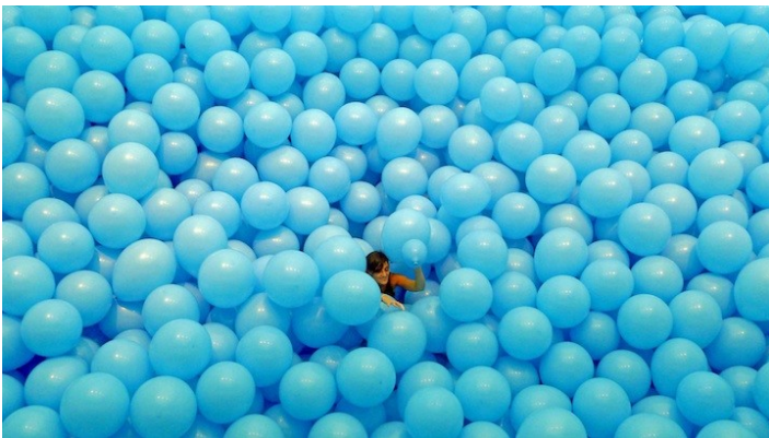
Martin Creed La moitié de l'air dans un espace donné Ballons aériens Dimensions variables A partir de 1998

Repérez et nommez les éléments d'analyse principaux en lien avec votre problématique sur chaque œuvre proposée.