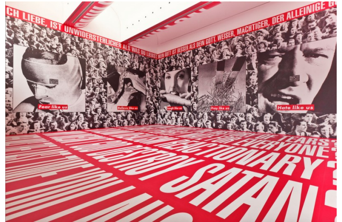
Sans titre, Barbara Kruger, 1994-1995 et 2014-2015, Sérigraphies de photographies, dimensions variables. Musée Ludwig, Cologne, Allemagne