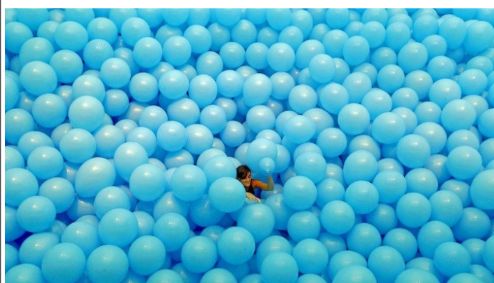
Martin Creed La moitié de l'air dans un espace donné Ballons aériens Dimensions variables A partir de 1998