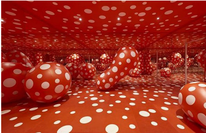
Yayoi Kusama, Dots Obsession , 1998, peinture, miroirs, ballons, adhésifs et air, 280 × 600 × 600 cm, inv. : 1999.2.7. Collection les Abattoirs, Musée – Frac Occitanie Toulouse.