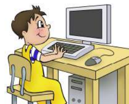
Jouer à l'ordinateur