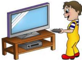
Regarder la télévision