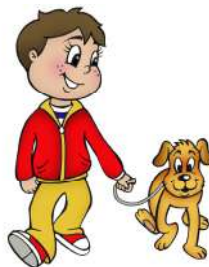
Prendre une marche