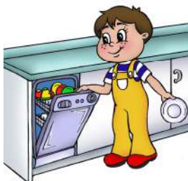
Participer aux tâches