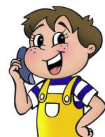
Appeler ceux que tu aimes