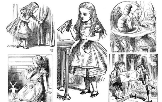
Lewis Carroll Alice au pays des merveilles 1863