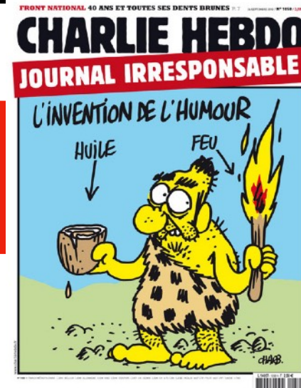
Une d'hebdomadaire Charb Journal Charlie Hebdo n°1058 2012