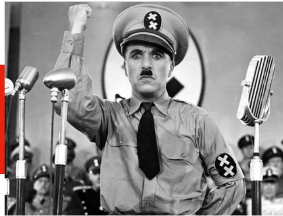
Caricature au cinéma Charlie Chaplin, Le dictateur , 1940