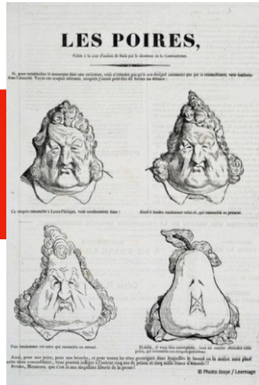
Dessin de presse, caricature Honoré Daumier , Les Poires 1832

En France, la caricature est une tradition républicaine, protégée par la loi sur la liberté de la presse de 1881 et par la jurisprudence des tribunaux.