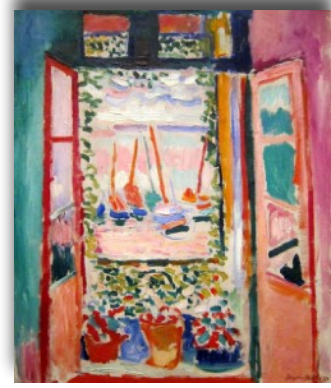
H.MATISSE Fenêtre ouverte à Collioure 1905