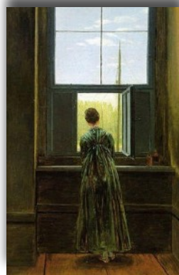
Caspar D. FRIEDRICH Femme à la fenêtre 1822