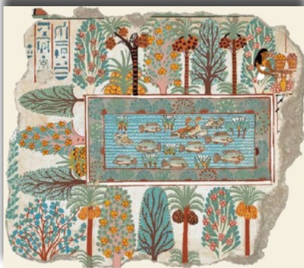
Le Jardin de Nébamon Fragment de paroi peinte, XVII e ou XVIII e ème dynastie Egypte