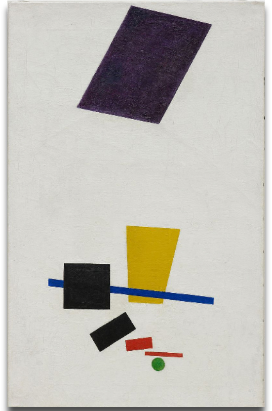
Kasimir MALEVITCH Réalité peinte d'un joueur de football. Masses colorées dans la 4 e dimension 1915 Institut d'art de Chicago, Chicago.