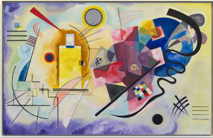
Wassily KANDINSKY, Jaune, rouge, bleu, 1925

-LES PIONNIERS DE L'ABSTRACTION : KANDINSKY MONDRIAN MALEVITCH