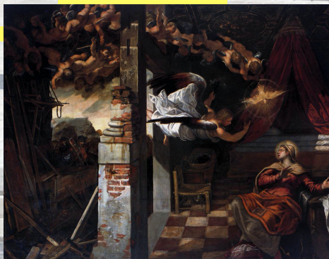
Le Tintoret, L'Annonciation, 1583/87