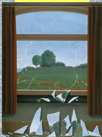
René Magritte, La Clé des champs, 1933