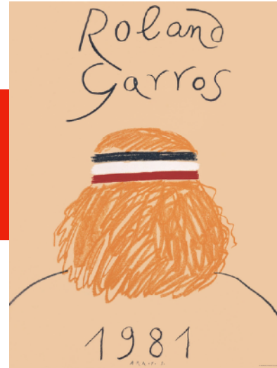
Eduardo Arroyo, Roland Garros 1981 ( lien ) 1980 Chaque année depuis 40 ans, la FFT donne carte blanche à un artiste pour réaliser l'affiche de Roland Garros !