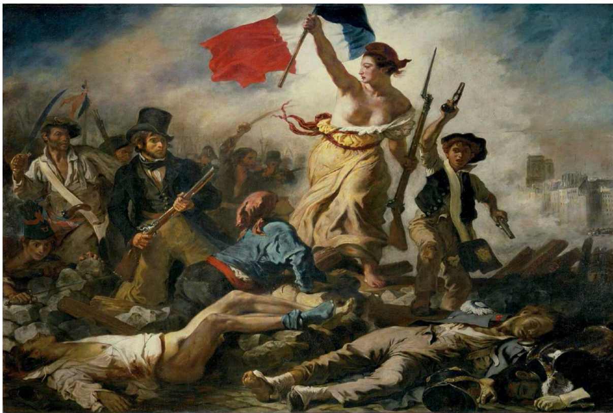
Eugène Delacroix La Liberté guidant le peuple 1830 Peinture à l'huile 260X325 cm