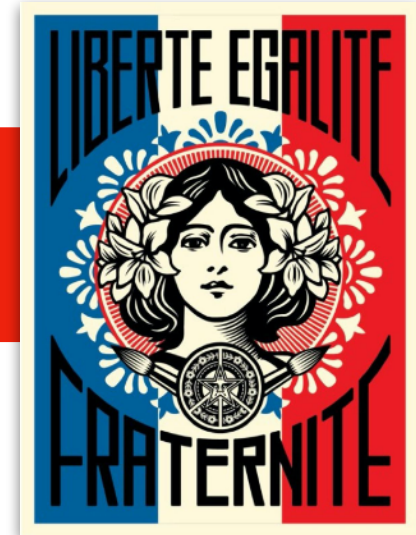
Shepard Fairey ( lien ), Liberté, Égalité, Fraternité , 2015