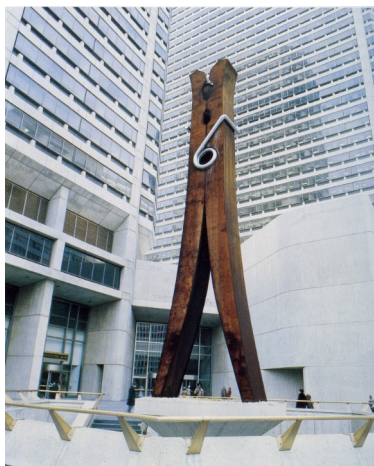
Claes Oldenburg , grande épingle , 14m, 1974.