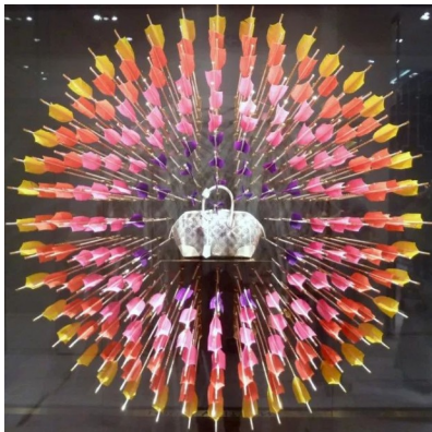
Louis Vuitton , sac avec flèches ;

consignes : Choisissez 4 œuvres sur les 9 proposées. Pour chacune d'elle, expliquez comment l'artiste est parvenu à mettre en valeur l'objet choisi.