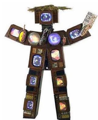
Nam June Paik , Karen Blixen Robot , 1996