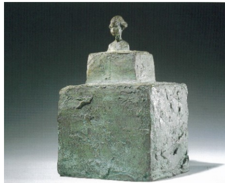
Alberto Giacometti , Petit buste de Silvio sur double socle , 1942 ;