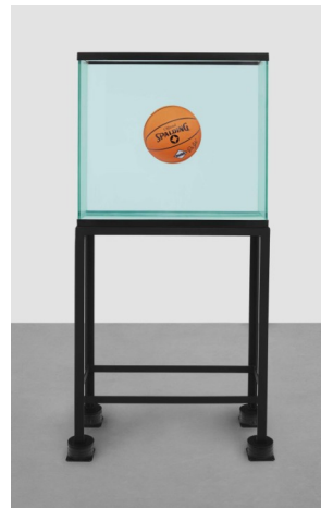
Jeff Koons , One ball total equilibrium tank , 1985