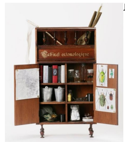
Fabre , Cabinet entomologique II , 1980

Cyril Hatt , Chaussures photographiées puis reconstruites.