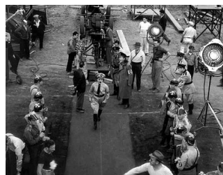
Vue en plongée