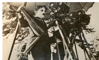
Vue en contre-plongée