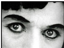
Très gros plan