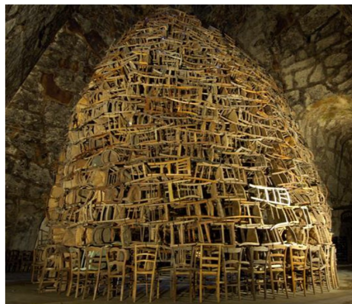
TADASHI KAWAMATA, Cathédrale de chaises , 2007