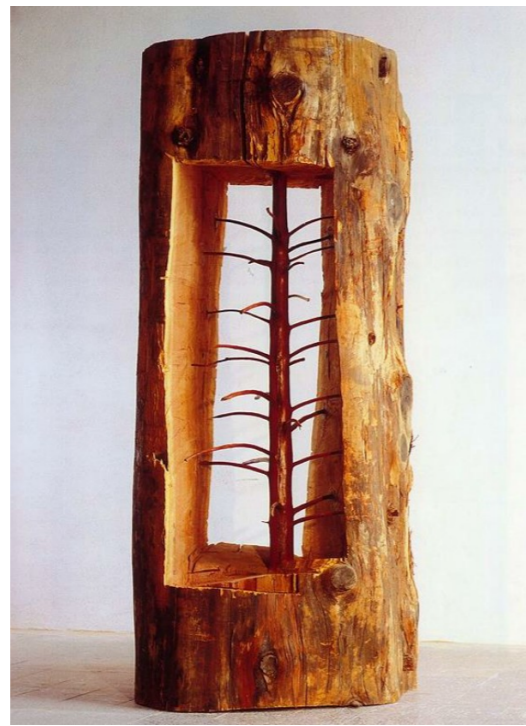
Giuseppe PENONE, le cèdre de Versailles , 2012