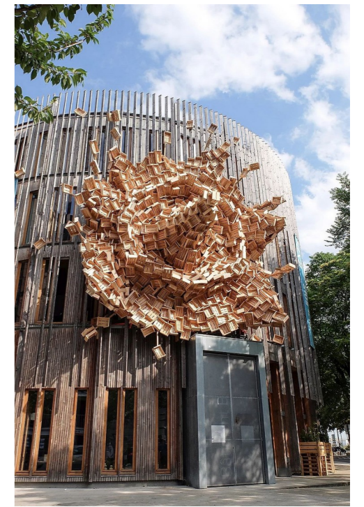
VOUS Design, Splash , 2017