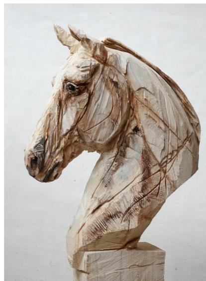
Juergen LINGL-REBETZ, cheval