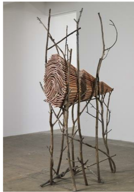
Giuseppe PENONE, Ombra di terra , 1999