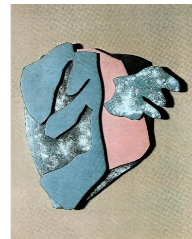
Hans ARP, portrait de Tristan Tzara , 1916