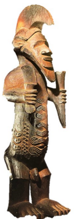
Fétiche africain en bois sculpté