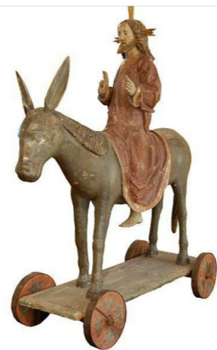
Christ polychrome en bois sculpté, XV e s