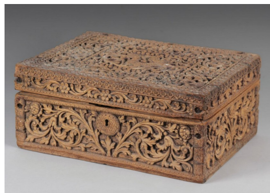
Anonyme, coffret en bois sculpté