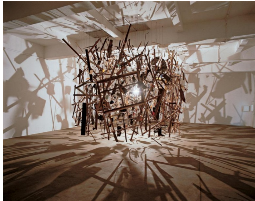
Cornelia PARKER, cold dark matter, and exploded view , 1991