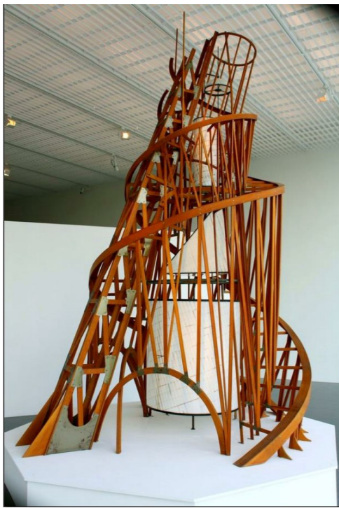
TATLINE, Maquette du monument à la III Internationale , 1919-1979.