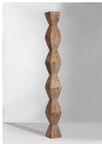
Constantin BRANCUSI, la colonne sans fin