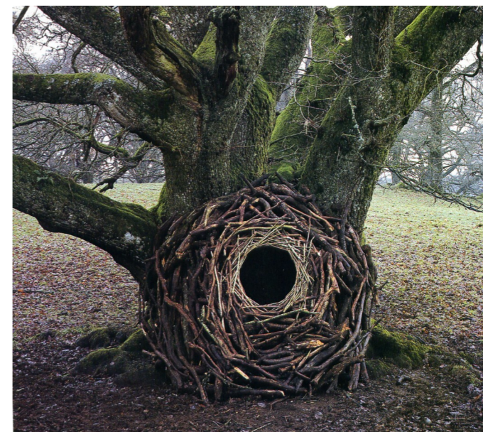
Andy GOLDSWORTHY, Sticks , 1989