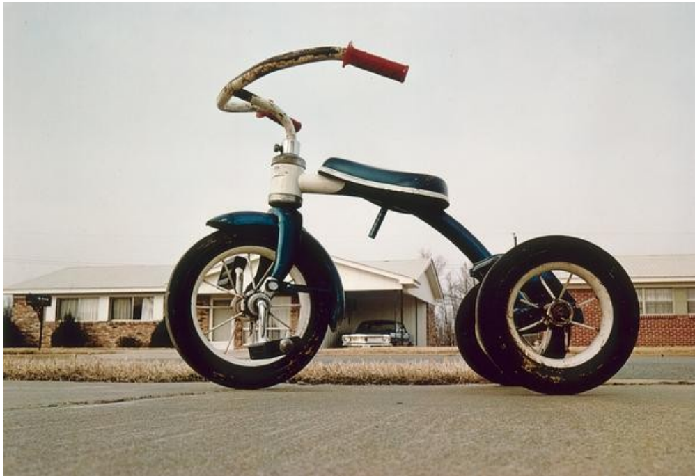
William Eggleston, Memphis (tricycle) 1969

En choisissant avec soin son point de vue, le photographe donne une impression de gigantisme à ce petit tricycle.