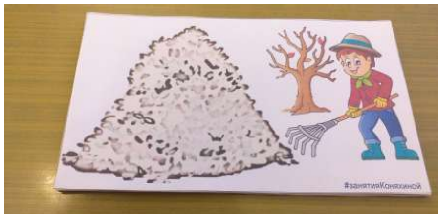
"С какого дерева лист" (узнавание по форме)