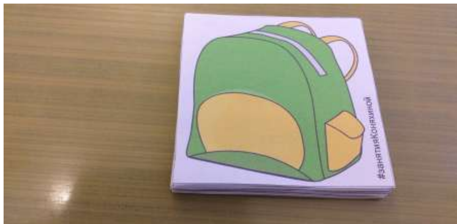
"Что положили в портфель" (группировка по отдельным признакам: что нужно взять в школу)