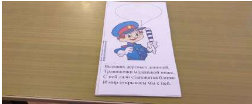
"Разгадай загадку" (знаний правил ПДД)