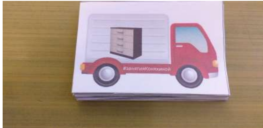
"Что везет грузовик" (называние предметов мебели, определение один-много)