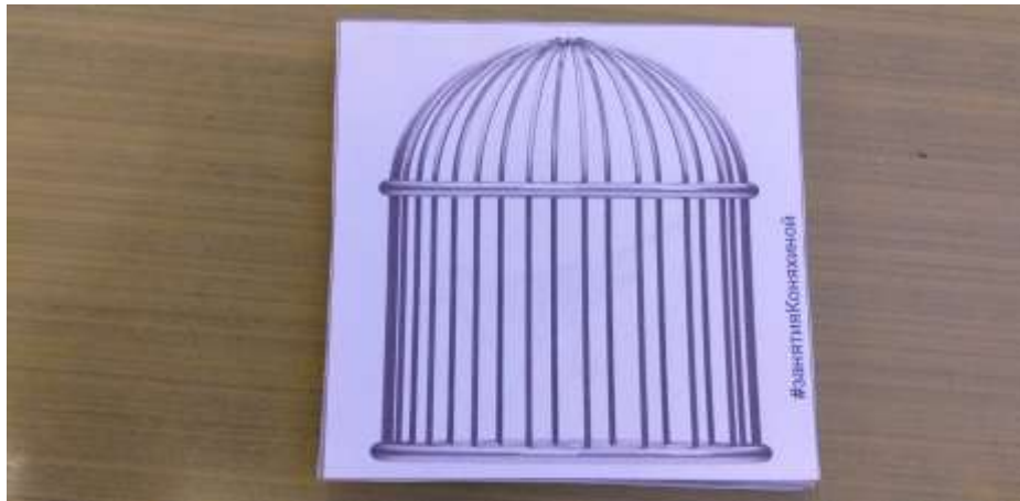
"Кто в клетке" (узнавание птиц по внешнему виду)