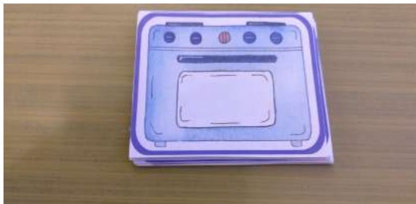
"Съедобное, несъедобное" (название продуктов)