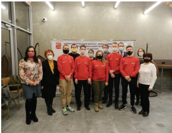
Рис. 1. Участники и наставники УИ Открытого регионального чемпионата

В процессе подготовки участника и при проведении УИ Открытого регионального чемпионата, рабочая группа столкнулась с рядом трудностей: