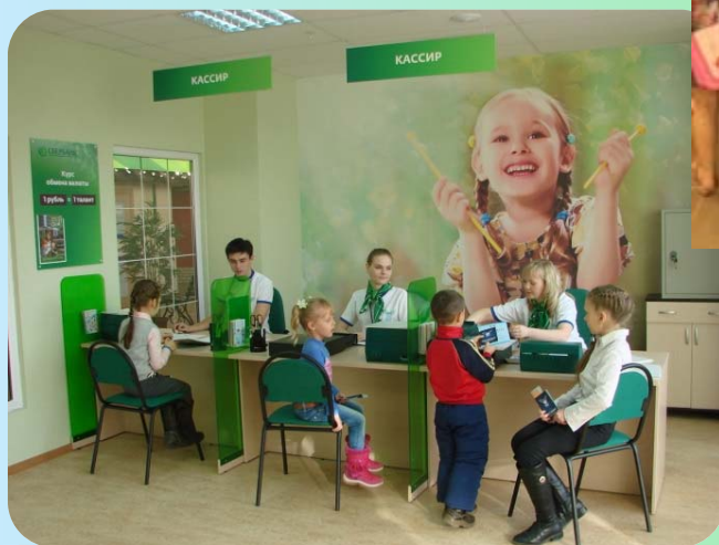
Экскурсия в банк