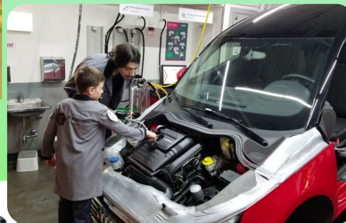
Экскурсия в автосервис