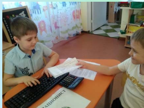
«Операционист и клиент»