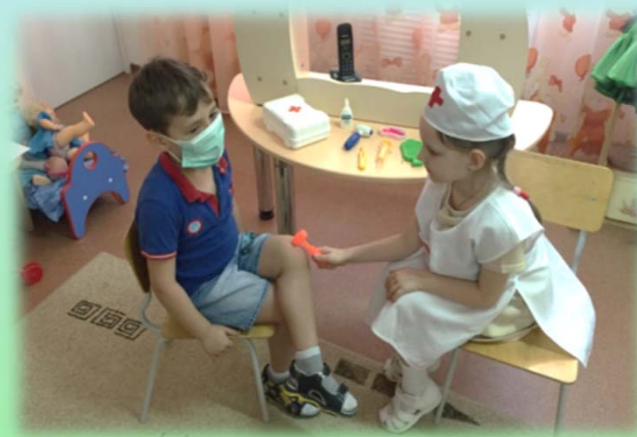
«На приеме у врача»