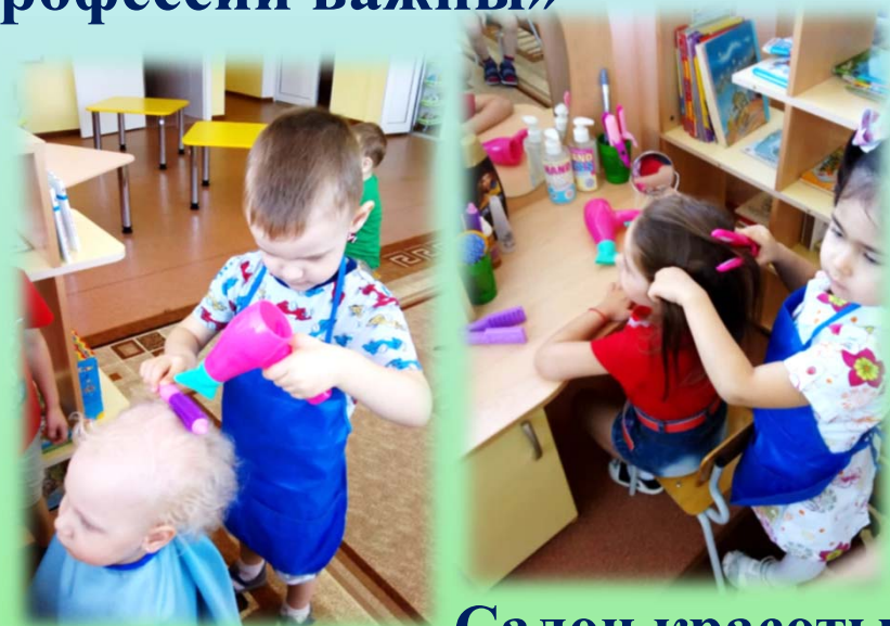
Салон красоты «Фантазеры»