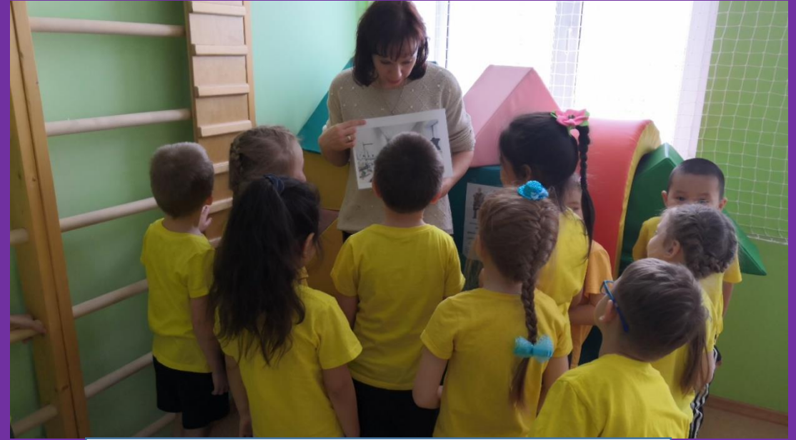
Рабочее место дизайнера - модельера