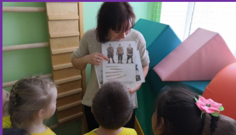
Одежда древних людей