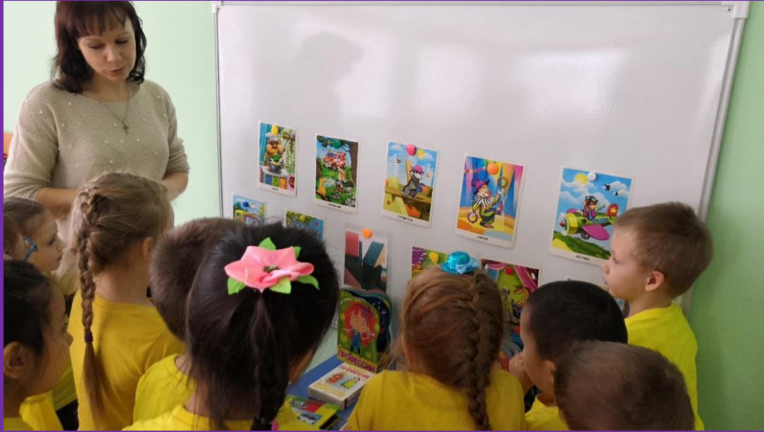
Поиск первой подсказки