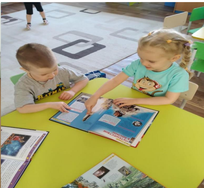
Рассматриваем книги о космосе.