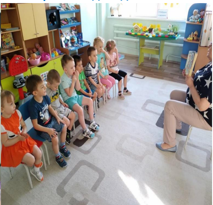
Познавательное видео «Этот загадочный космос», читаем отрывок из книги Н. Носова «Незнайка на Луне».