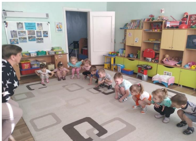
Игра «Земля, вода, воздух, огонь»