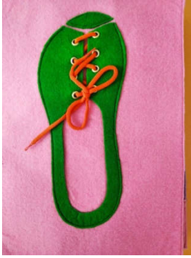
Страница 7 «Башмачок» (шнуровка)