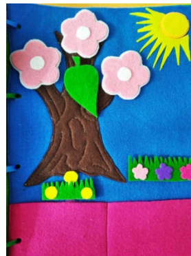
Страница 9 «Времена года» (ознакомление с окружающим – признаки времен года)