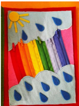
Страница 10 «Радуга» (мелкая моторика – расстегивание и застегивание замков; знакомство с природным явлением; знакомство с геометрическими фигурами: внутри каждого замка находятся геометрические фигуры разного цвета)