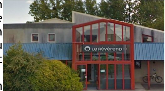
Imprimerie Le Révérend 50700 VALOGNES

L'édition est un ensemble d'exemplaires d'un ouvrage publié, un éditeur va par la suite créer le modèle informatique du produit en question et un imprimeur se chargera du passage du format numérique au format papier de celui-ci.