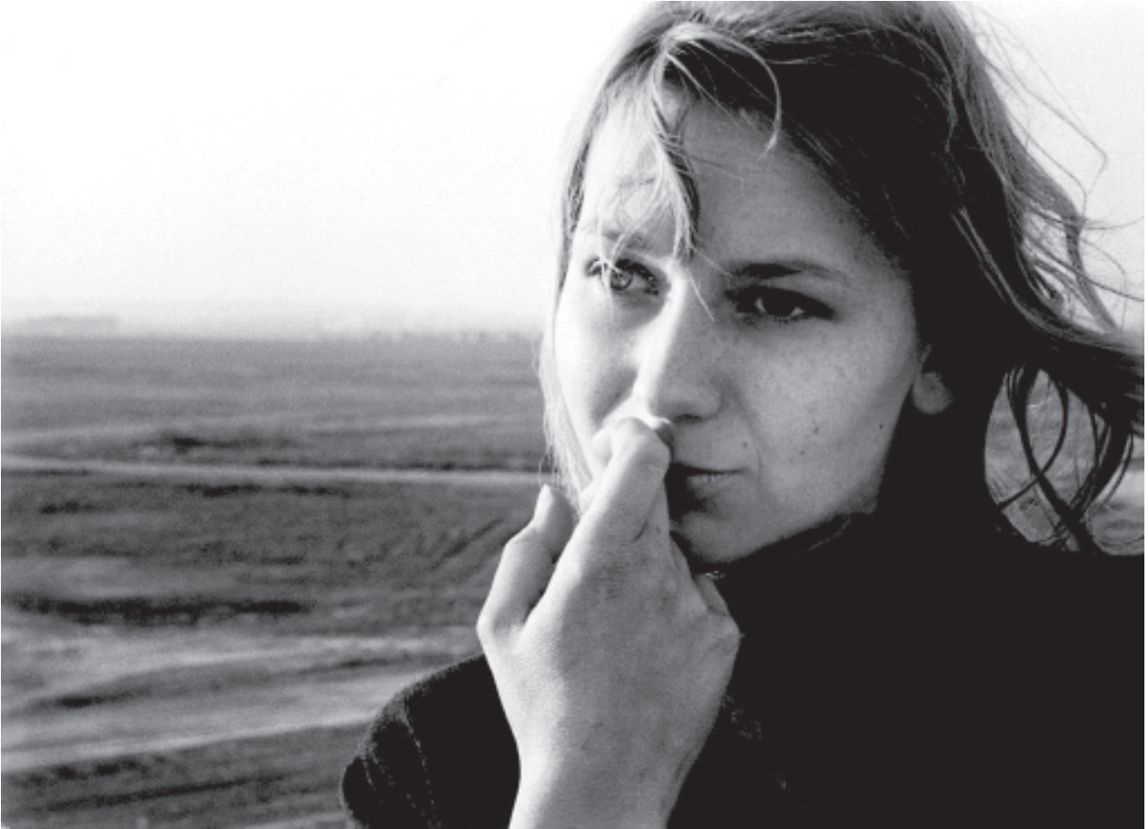
Chris Marker, extrait de La Jetée , 1962