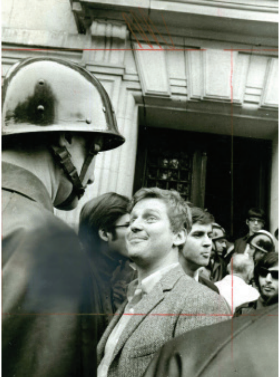
Daniel Cohn-Bendit face à un policier devant la Sorbonne, Paris, 6 mai 1968