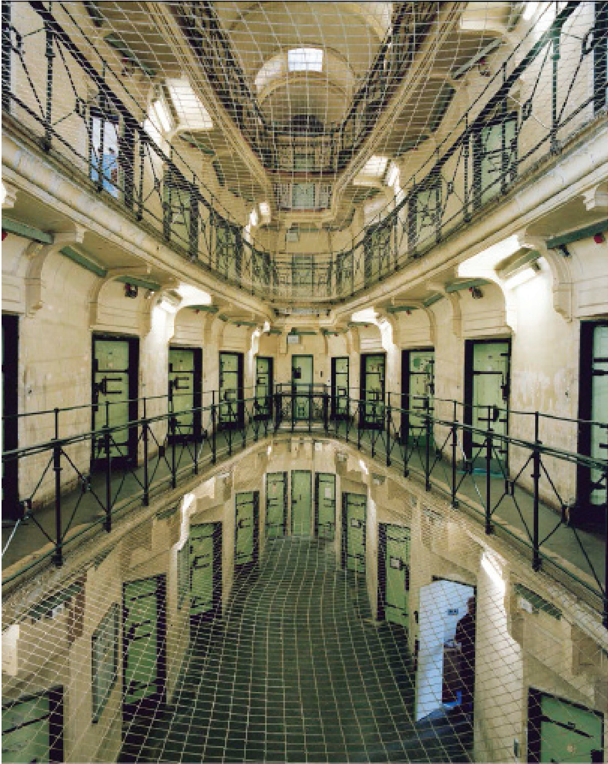
Maxence Rifflet, centre pénitentiaire de Caen, 2018, extrait de Nos prisons , 2020