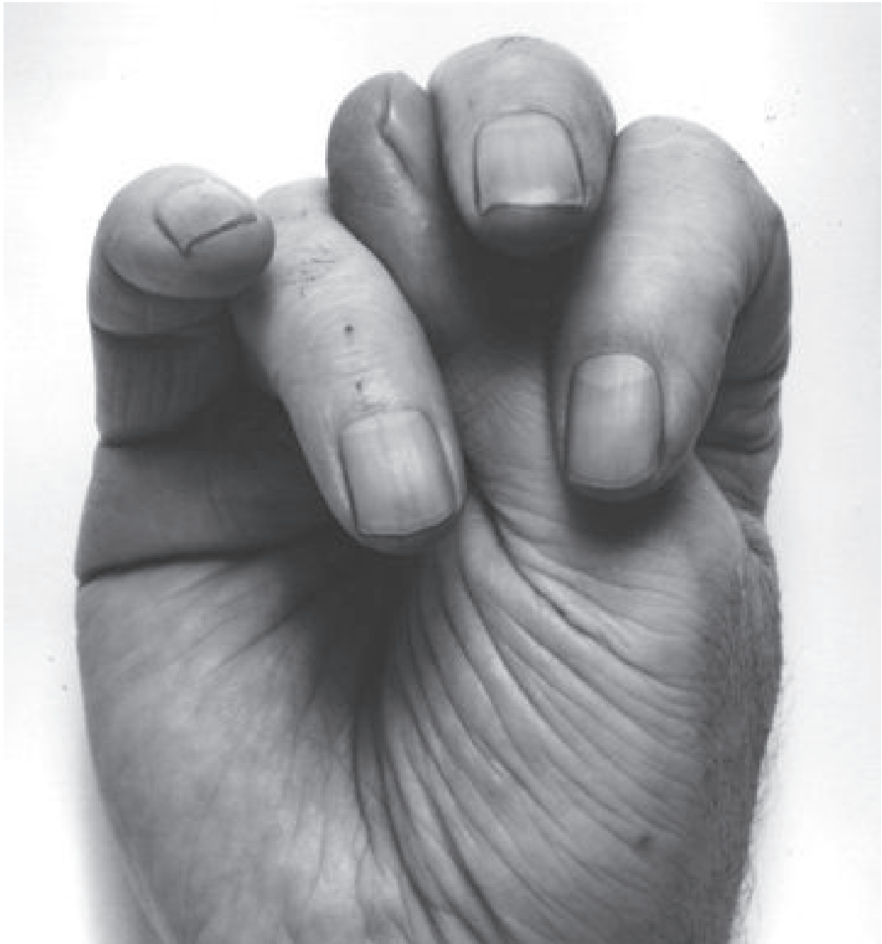
John Coplans, Self-Portrait (front hand, thumb up middle) , 1988