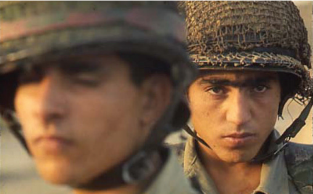
Gilles Caron, Soldats israéliens, 1967