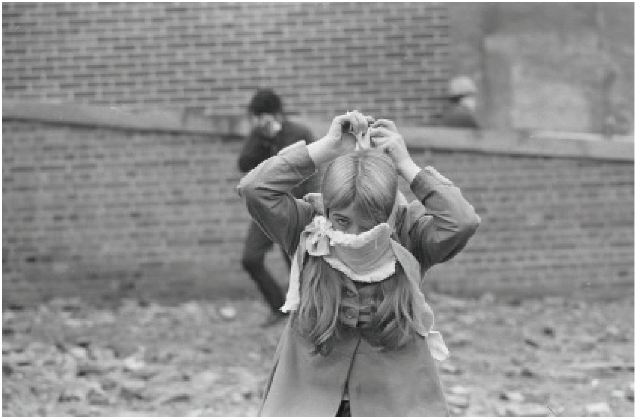
Gilles Caron, Manifestante républicaine, Derry, Irlande du Nord, août 1969