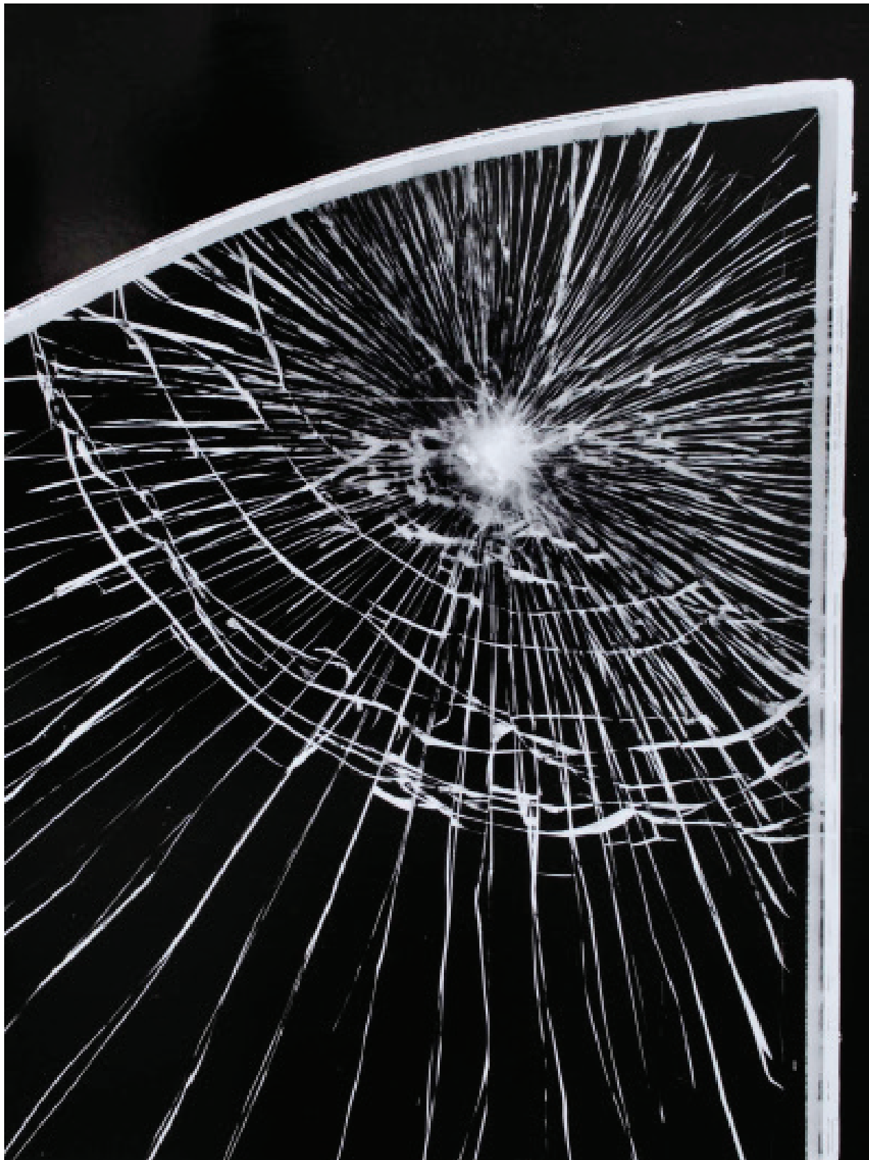
Gilles Pourtier, extrait de L'obscurité est si solidement établie en nous , 2020