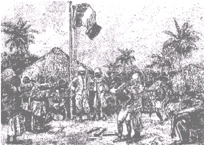
Brazza délivre des esclaves

Un jour où le drapeau fut hissé près d'un village du Congo, une troupe d'esclaves passa. Brazza la fit arrêter et il dit : « Partout où est le drapeau de la France, il ne doit pas y avoir d'esclaves. »