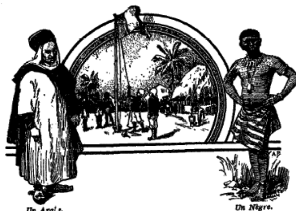
Le drapeau français flotte en terre conquise

En l'année 1830, le roi Charles Dix envoya des vaisseaux attaquer la ville d'Alger, parce que les Algériens faisaient beaucoup de tort à notre commerce en arrêtant et pillant nos navires.