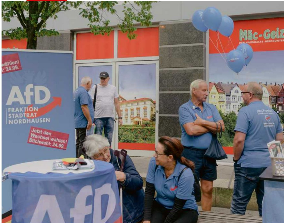
Stand de militants du parti d'extrême droite Alternative für Deutschland (AfD), jeudi à Nordhausen.