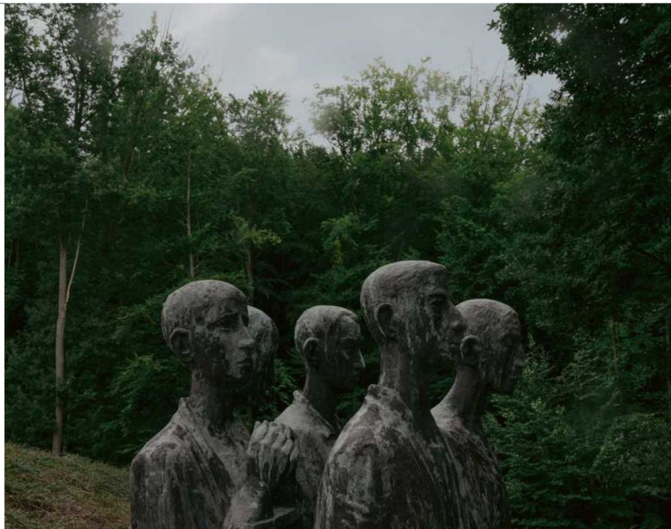
Au mémorial du camp de concentration de Dora, à Nordhausen.