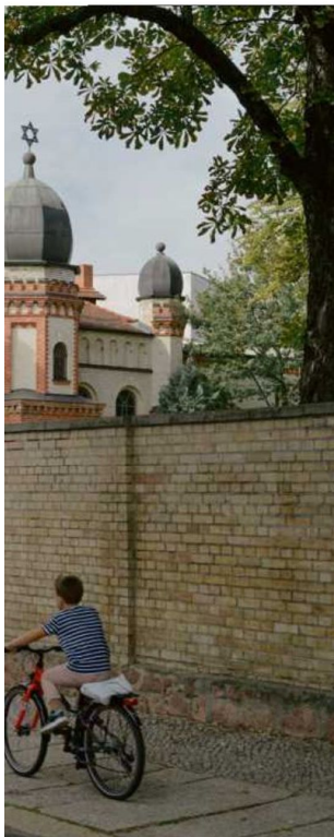
a été visée par un attentat en 2019.