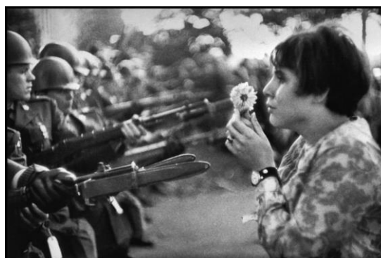
La jeune fille à la fleur, USA. Washington DCoct 1967