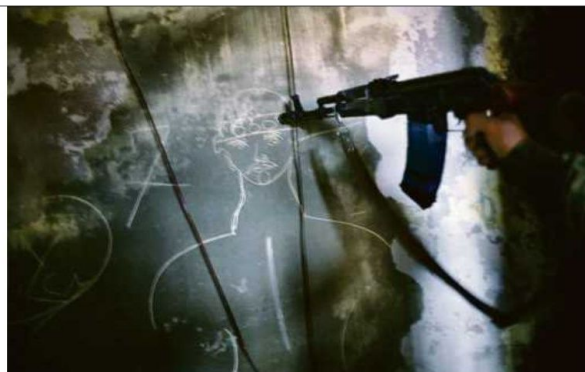
Un soldat russe à Grozny (Tchétchénie), en 2000.

Outre ces guerres clairement déclarées et menées ouvertement par son armée, la Russie s'est impliquée militairement dans plusieurs conflits loin de ses frontières, sans le reconnaître. Vladimir Poutine a recours pour ce faire aux mercenaires du groupe Wagner. Une société gérée par l'un de ses plus proches, directement lié au Kremlin. Ces miliciens de sinistre réputation sont apparus sur différents théâtres d'opérations militaires impliquant plusieurs forces internationales, dont la Libye, la République centrafricaine ou le Mali. En un peu plus de vingt ans au pouvoir, Vladimir Poutine a toujours préparé ou livré une guerre sous différents prétextes. Invoquant tantôt les menaces contre la Russie, la lutte contre le terrorisme ou comme tout dernièrement la «dénazification» de l'Ukraine, il a cherché à diaboliser ses «ennemis» pour justifier ses entreprises belliqueuses. Mais le schéma de construction d'une pseudo-justification puis d'une intervention s'est finalement maintes fois répété, tout au long d'une meurtrière double décennie. ♦