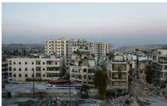
A Alep (Syrie), en 2015.