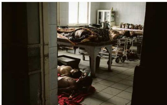
A la morgue de Donetsk (Ukraine) en juillet 2014.