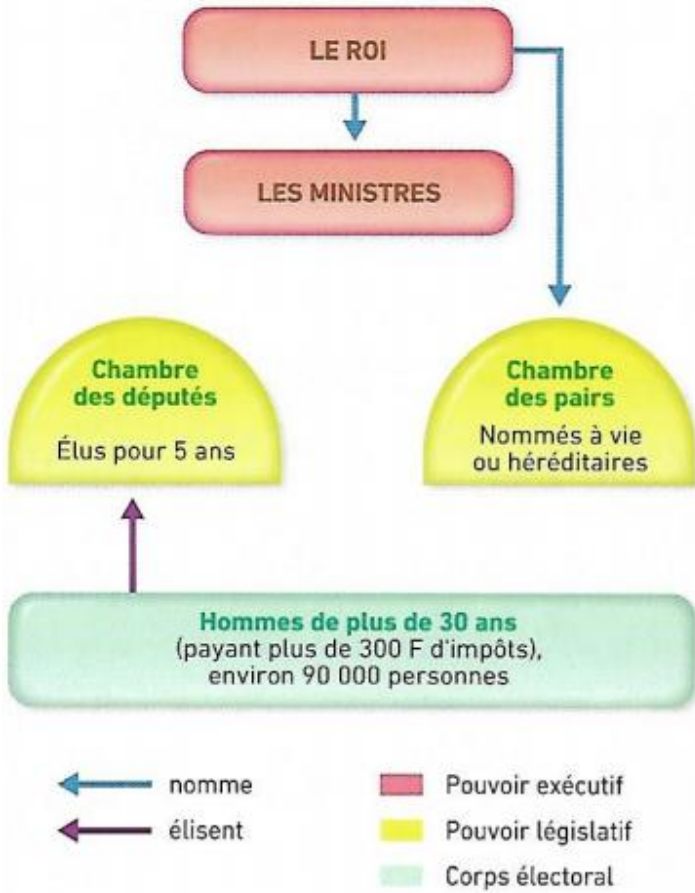
Doc. 1 : Charte de 1814 (Restauration)