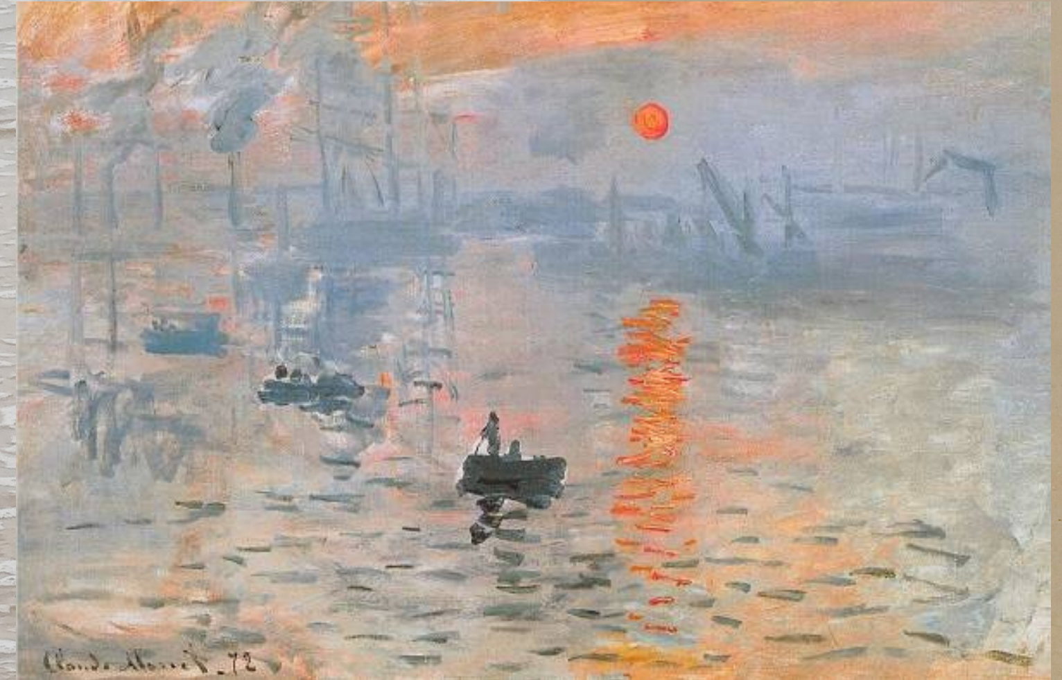
IMPRESSION SOLEIL LEVANT (1872)