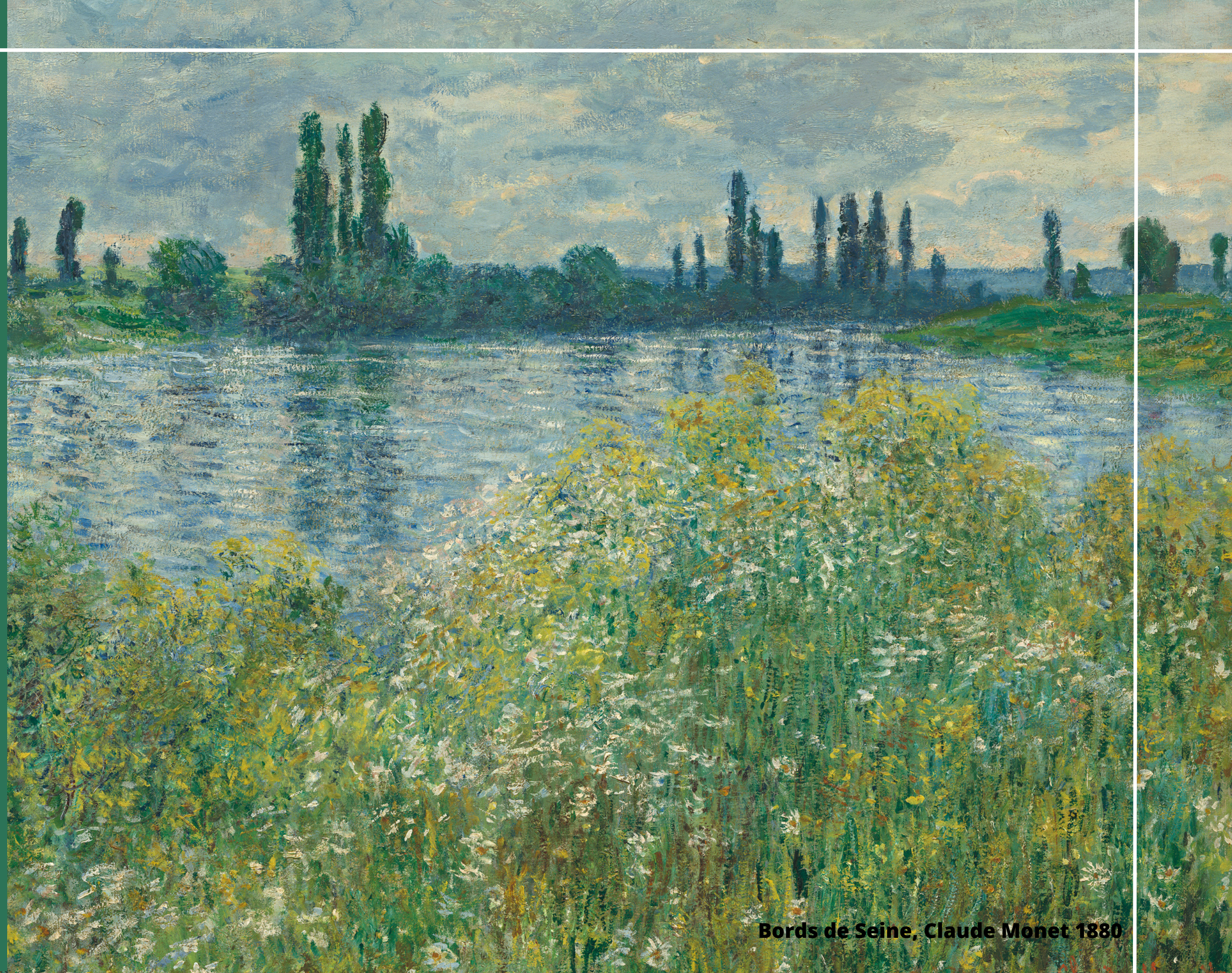
Bords de Seine, Claude Monet 1880