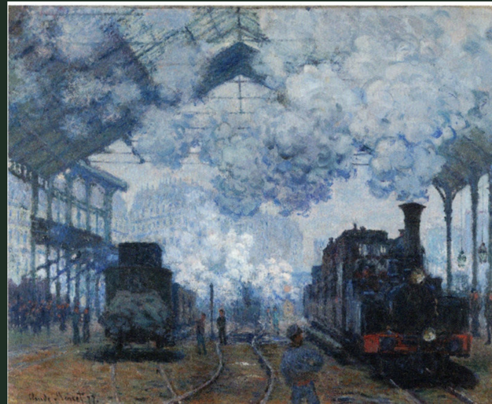
L'intérieur de la gare Saint Lazare de Claude Monet, 1877