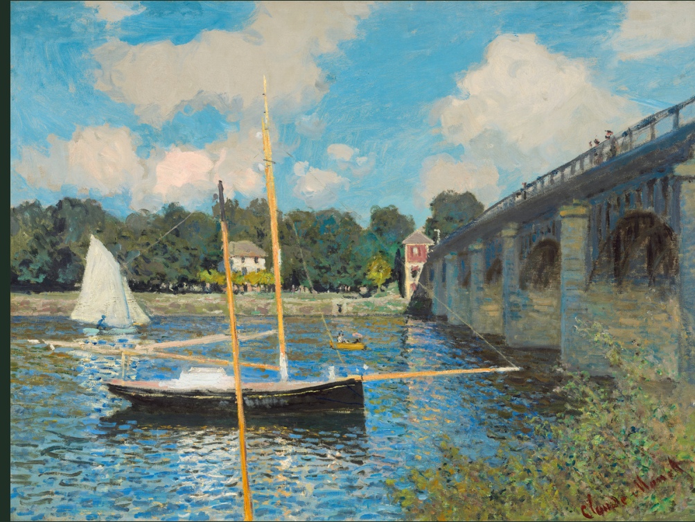
Le pont d'Argenteuil de Claude Monet, 1874.