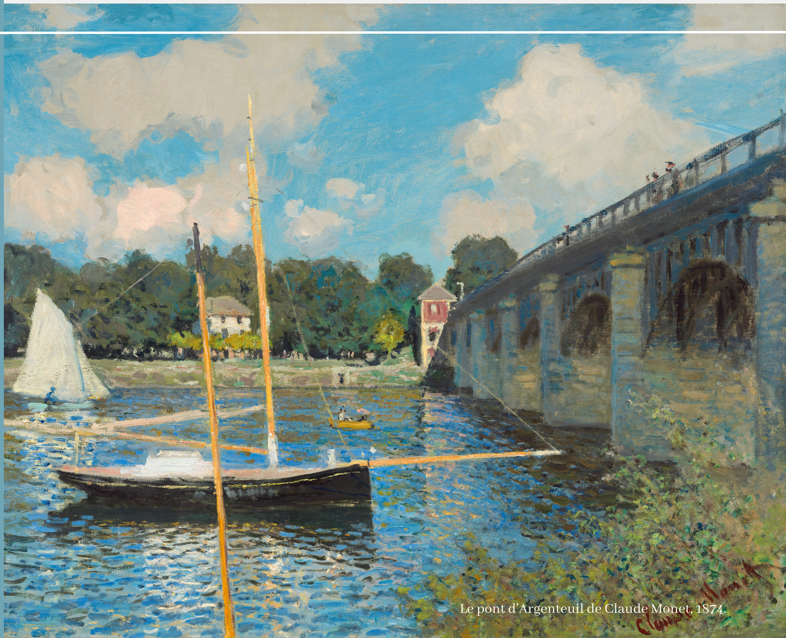
Le pont d'Argenteuil de Claude Monet, 1874.