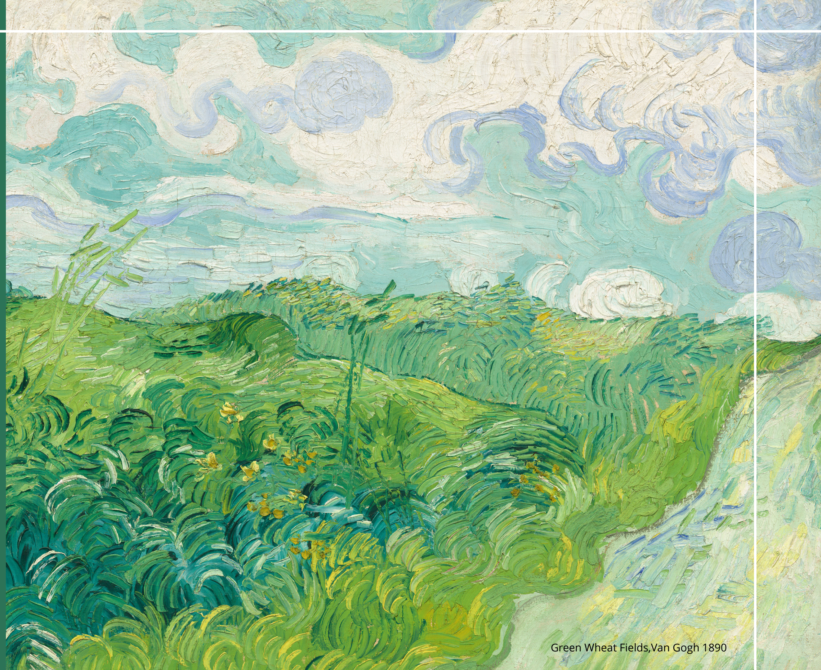
Green Wheat Fields, Van Gogh 1890