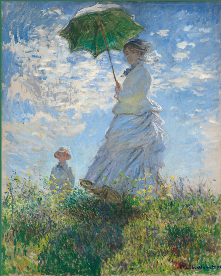
Femme à l'ombrelle (La ballade) Claude Monet 1875