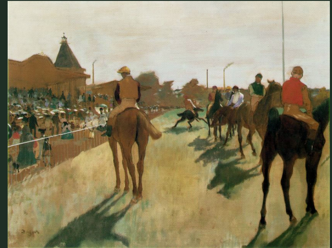
Course de chevaux d'Edgar Degas, 1868