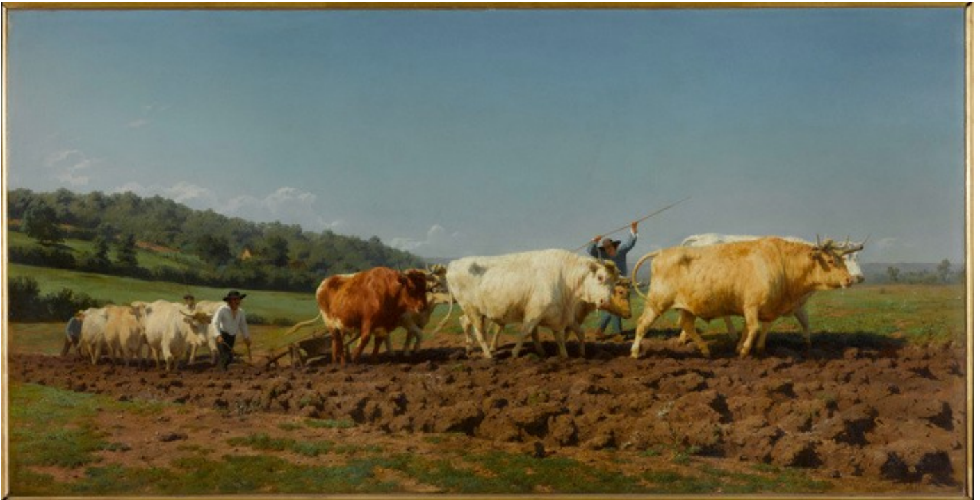
Rosa Bonheur (1822-1899), Labourage nivernais , 1849, huile sur toile, 133 x : 260 cm, achat après commande de l'État en 1849, musée d'Orsay