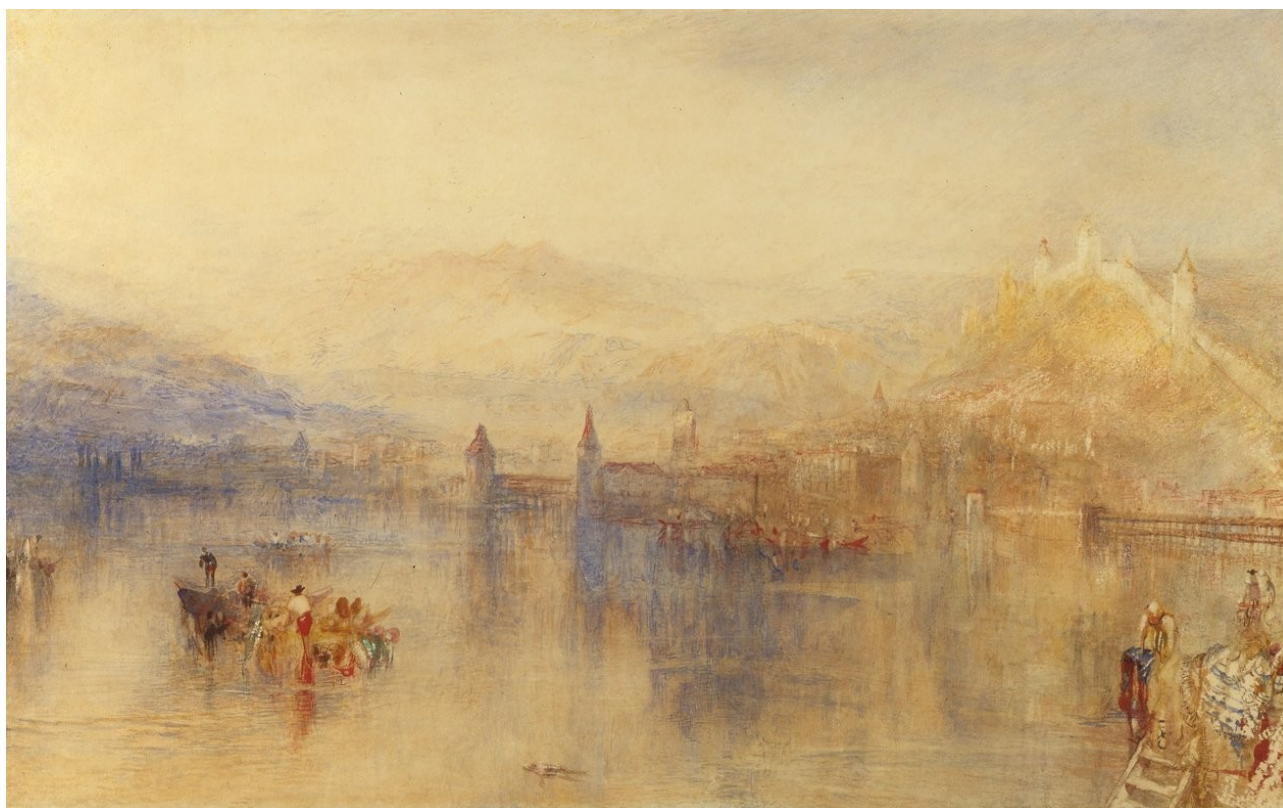
William Turner, Lucerne depuis le lac , 1800-1851, 29,5 x 47,3 cm