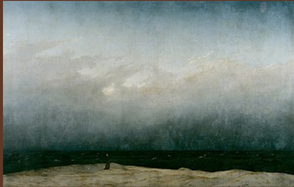
Le maine au bord de la mer 1808-1810 Friedrich