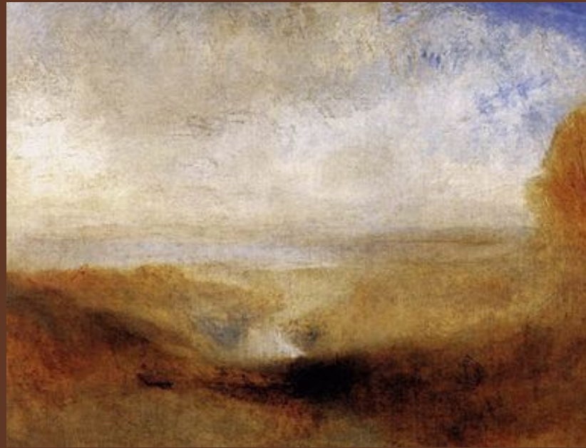
Landscape with a river and a bay in the background 1840-1850 Turner