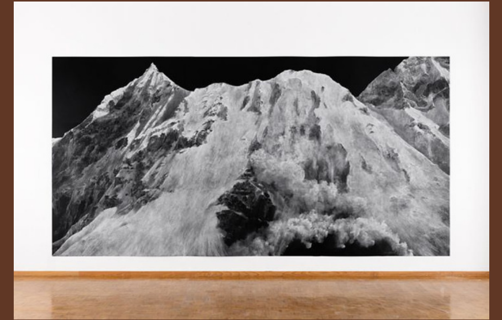
The Montafon Letter 2017 Tacita Dean