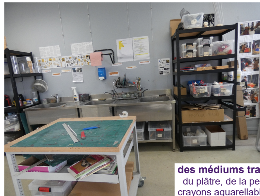
des médiums traditionnels : de l'argile, du plâtre, de la peinture, des encres, des crayons aquarellables, des estompes, du fil de fer...