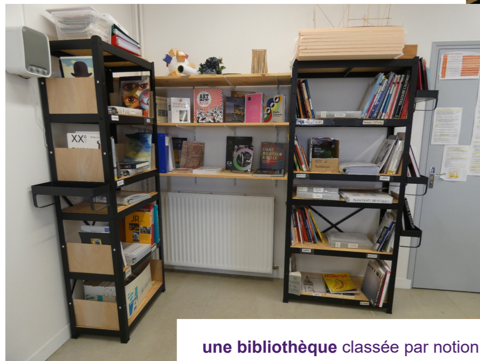
une bibliothèque classée par notion