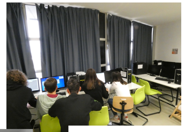
des ordinateurs pour créer et faire des recherches