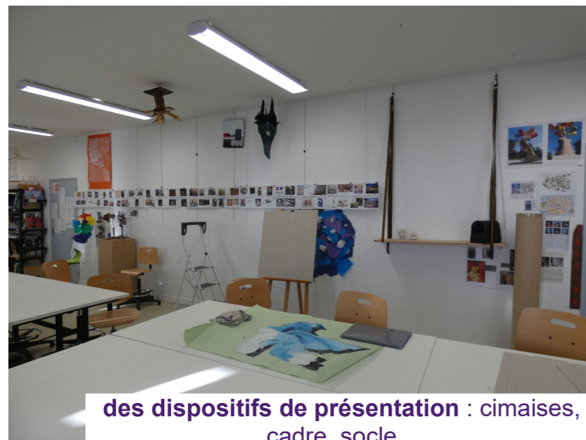
des dispositifs de présentation : cimaises, cadre, socle...