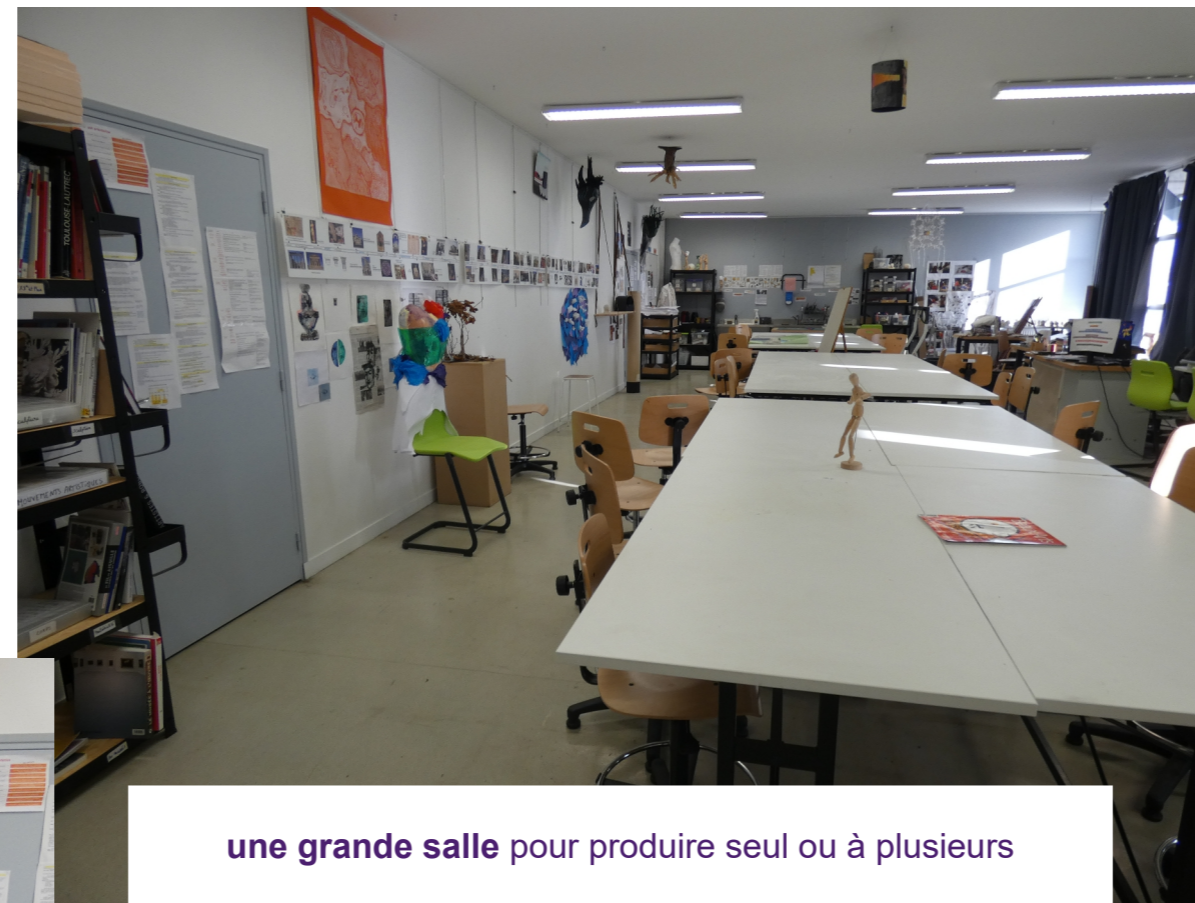
une grande salle pour produire seul ou à plusieurs