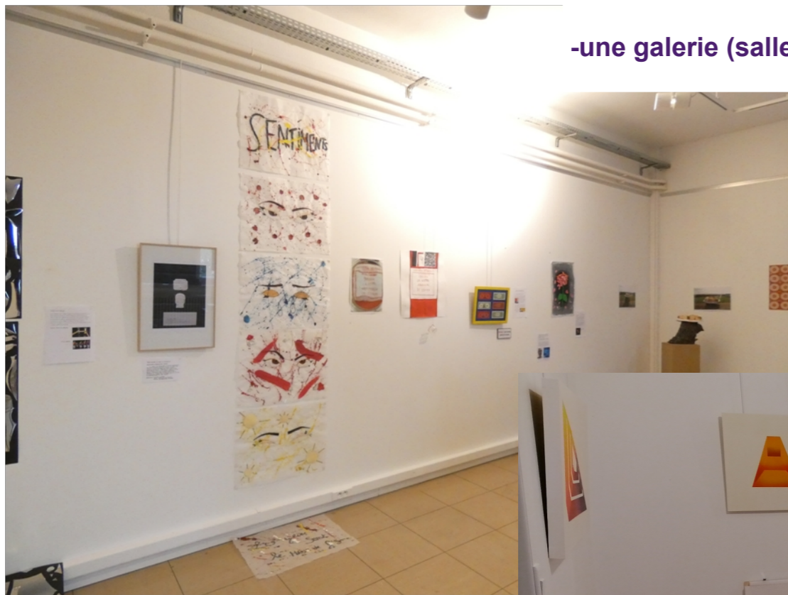
-une galerie (salle D 06) pour exposer les productions d'élèves et celles des artistes