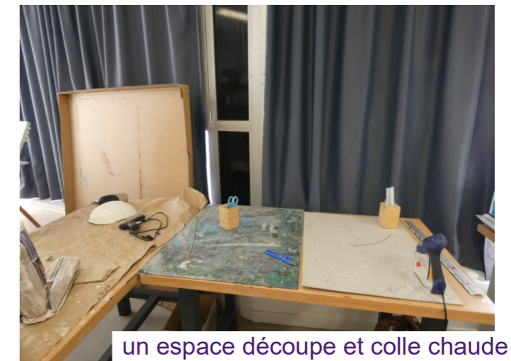
un espace découpe et colle chaude