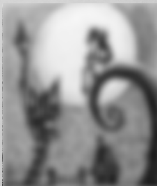
Tim BURTON, dessin préparatoire au film animé l'étrange Noël de Mr Jack, 1990.