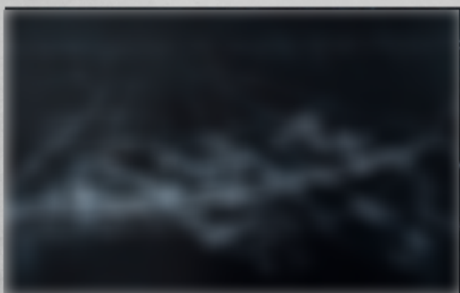
Silke SILKEBORG, Stuttgart de nuit, peinture, 2015.