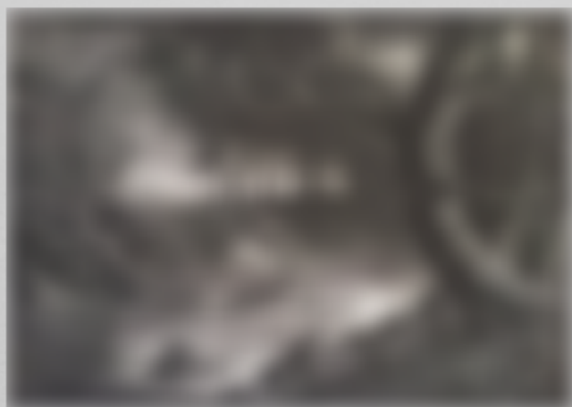
Jules GREBERT, Le lever du soleil, gravure, 19 ème .