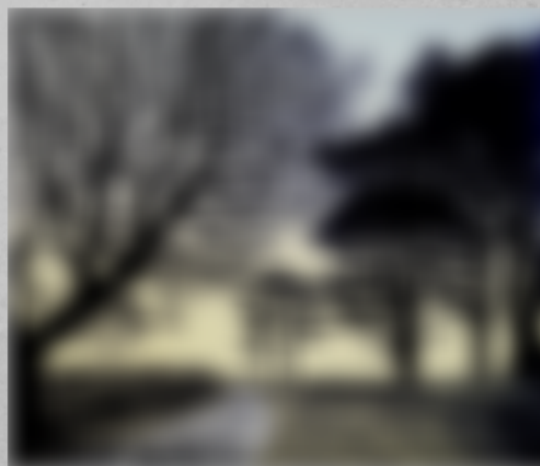
Richard SHIMELL, A la mer. linogravure. 2020.