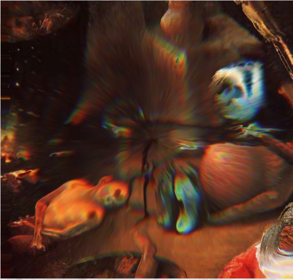
Jérôme BOSCH , Le jugement dernier (détail), après 1482, huile sur panneau de bois.