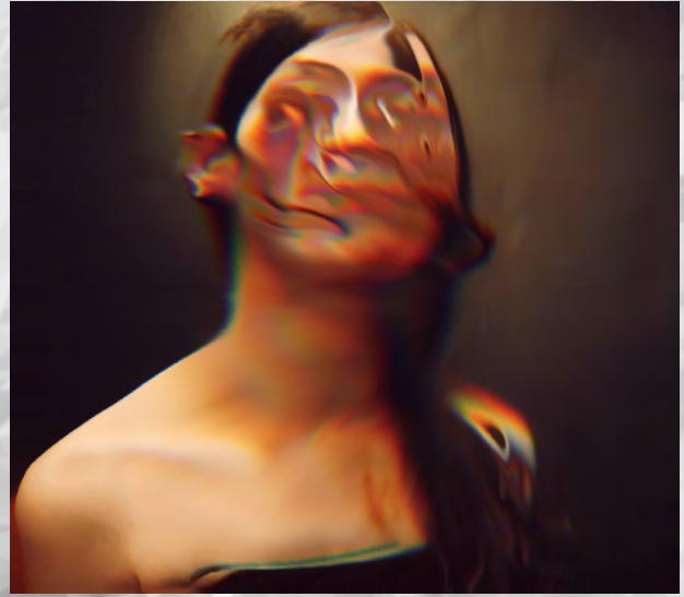
Michael Burton , Nanotopia, 2006, image extraite de la vidéo éponyme (4min 14s).