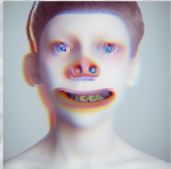
Oleg DOU , MK3 (série Mushroom kingdom), 2005, photographie et retouche numérique, 120/120 cm.