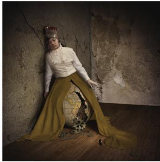
Jamie Baldrige. My Steady World, 2007, photographie.