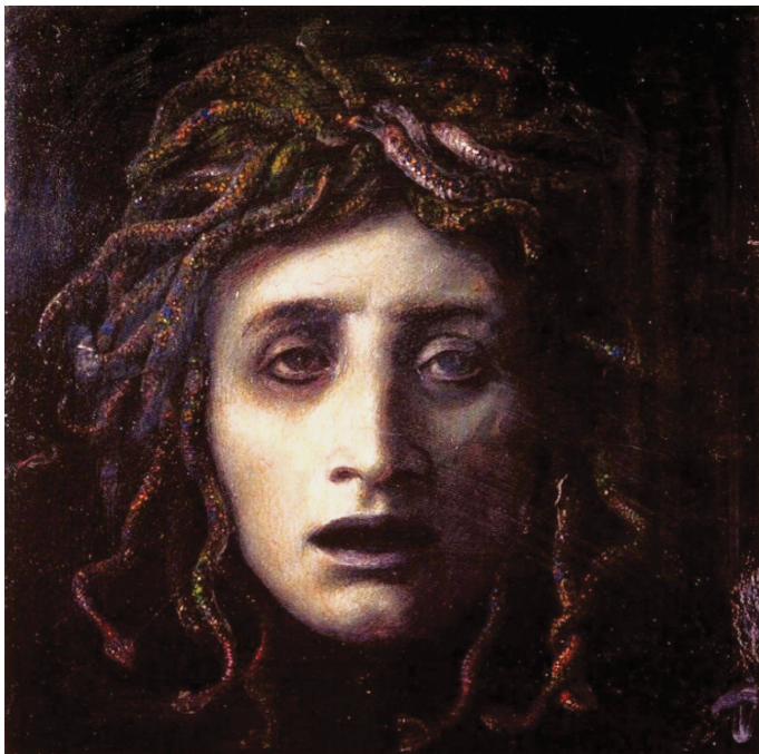
Arnold BÖCKLIN, Méduse, huile sur toile, vers 1878.