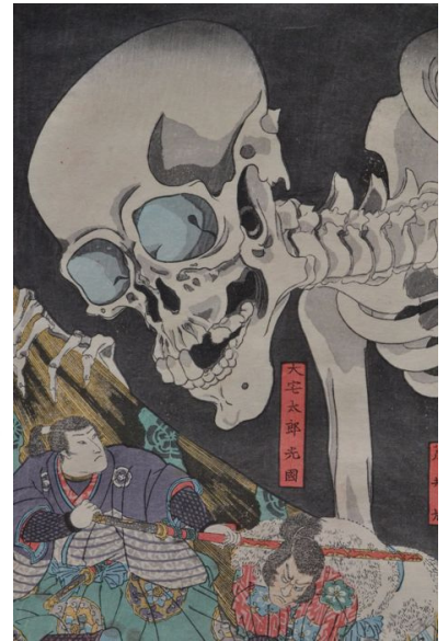
Utagawa Kuniyoshi, La princesse Takiyasha invoquant un monstrueux squelette dans l'ancien palais de Soma, vers 1845-1846. Estampe en couleurs. Triptyque (partie gauche).