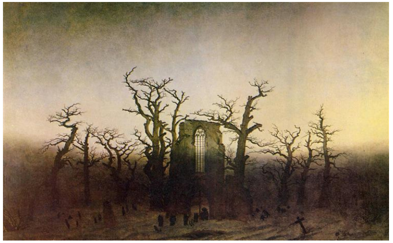
Caspar David FRIEDRICH, L'abbaye dans une forêt de chêne, 1810, huile sur toile.