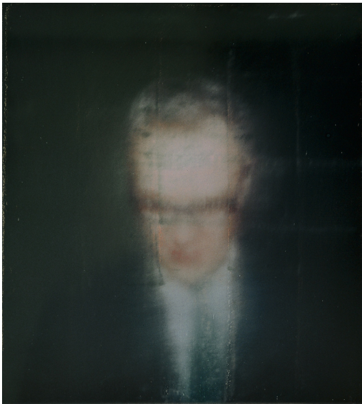
Gerart RICHTER, Autoportrait, 1996, huile sur toile.