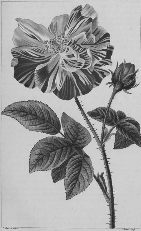
Rosa Gallica . var.