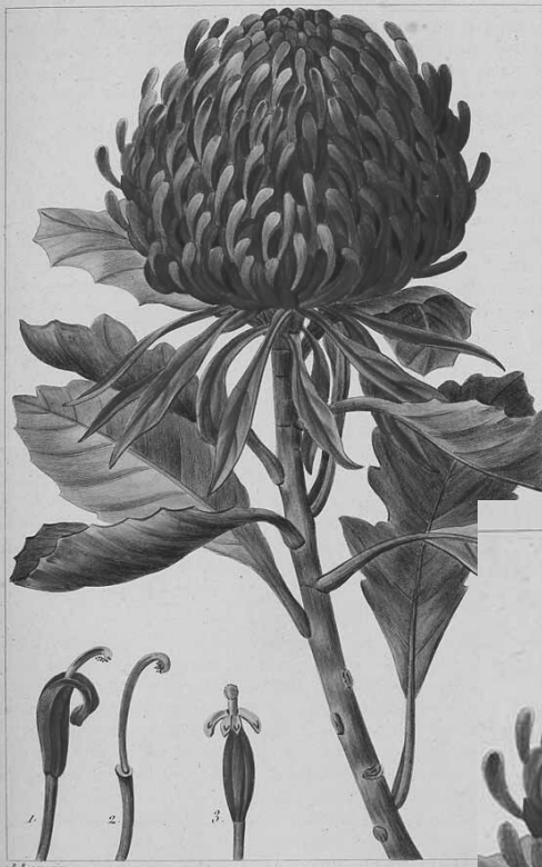
Telekia speciosissima .