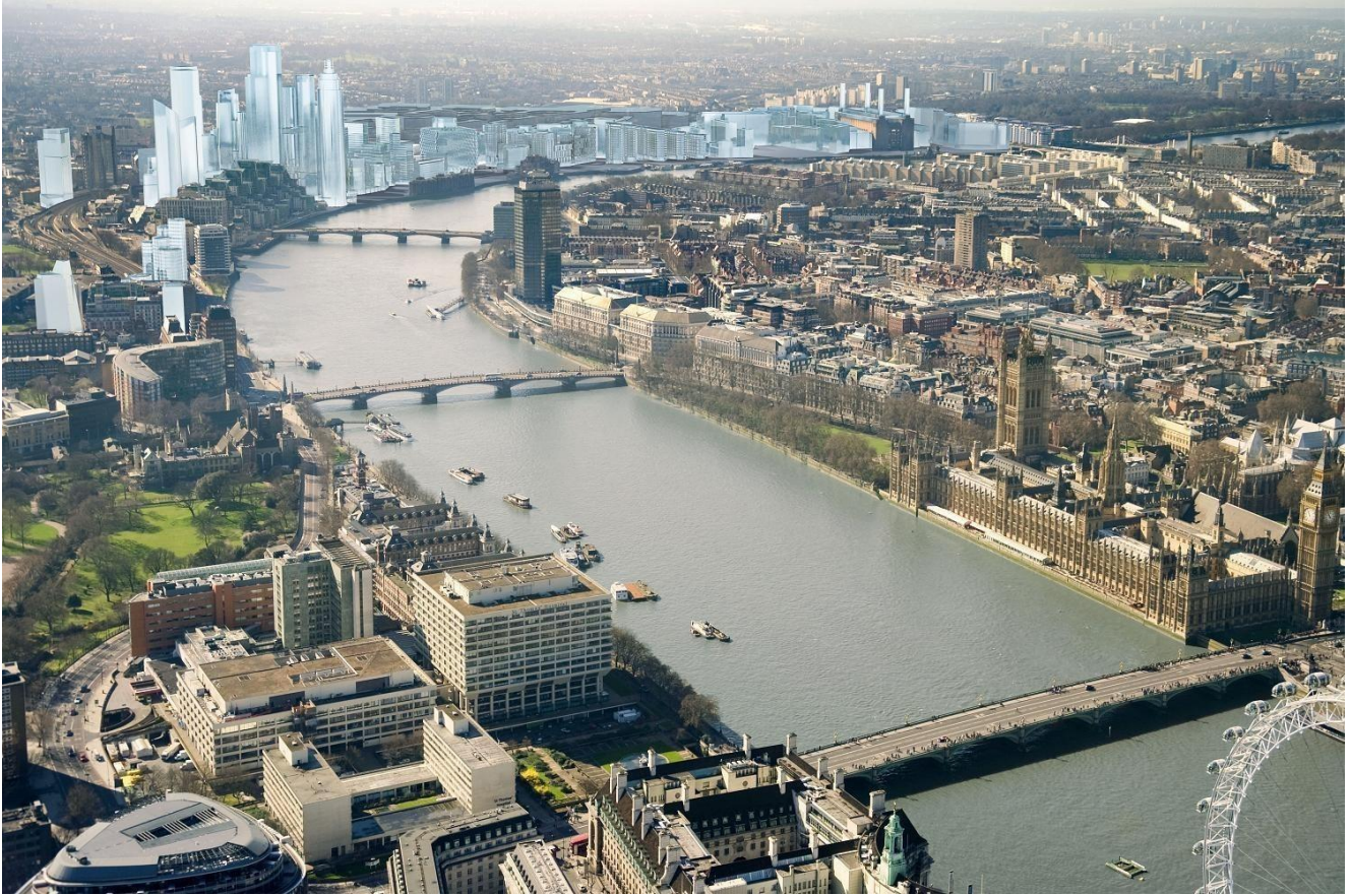
5b- Travail à partir image du futur Londres: imaginer le story line de la Tower of London