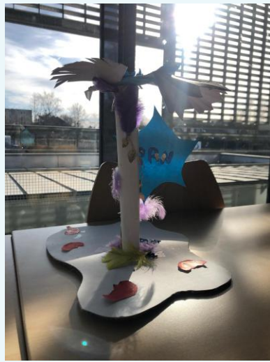
Portrait chinois (3èmes)