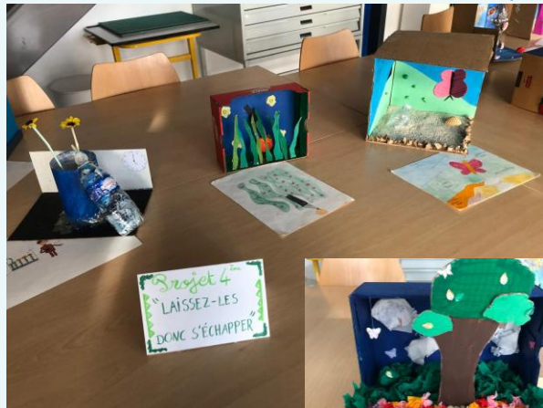
Nature morte contemporaine (4èmes)