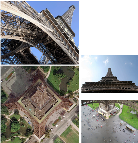
4 photographies de la tour Eiffel vue en plongé et en contre plongé