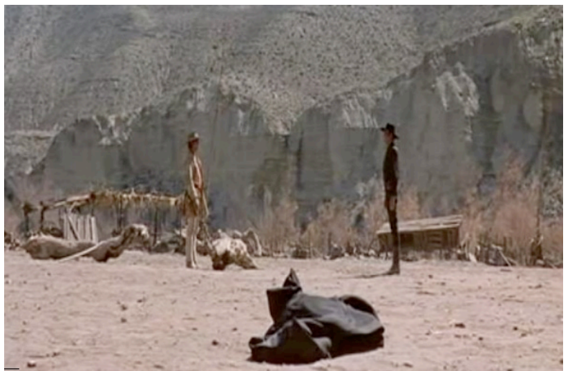
La tour Eiffel ( 2 tableaux) - Robert Delaunay - huile sur toile - 1926.