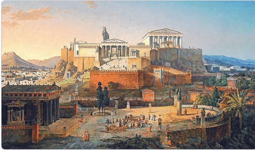
▲ Афинский Акрополь. Реконструкция

Полисы выросли из небольших укрепленных поселков. Центром полиса был город. К нему примыкала окружавшая его территория с немногочисленными поселениями. В каждом таком государстве проживало в среднем от 5 до 10 тыс. человек.