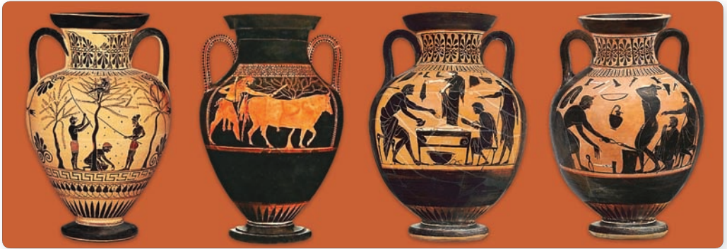
▲ Занятия древних греков. Рисунки на древнегреческих вазах

ремесла и торговля пришли в упадок. Земледельцы трудились не покладая рук, но твердые почвы плохо поддавались обработке деревянными и медными орудиями труда.