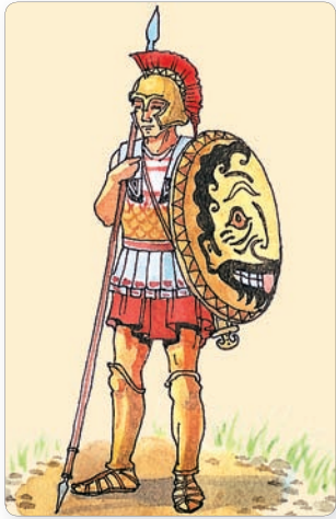
▲ Гоплит. Современный рисунок

всех этих прав и гражданами не являлись. Поэтому они чаще всего занимались ремеслом и торговлей. Абсолютно бесправными были только рабы.