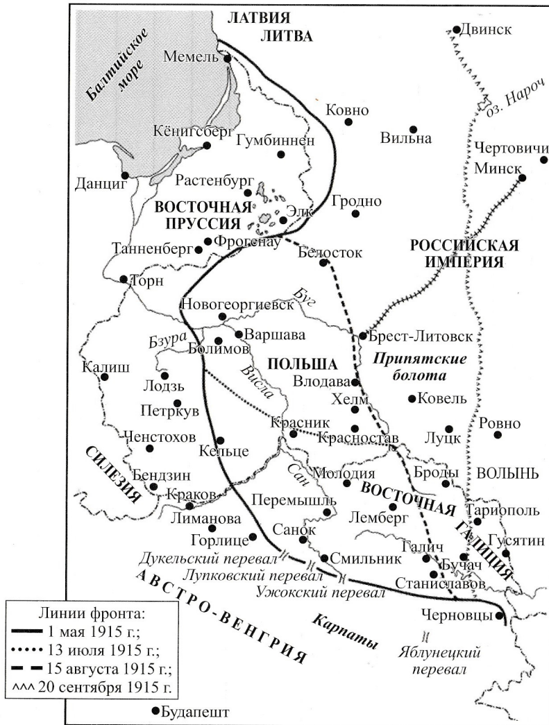
Восточный фронт в 1915—1916 гг.