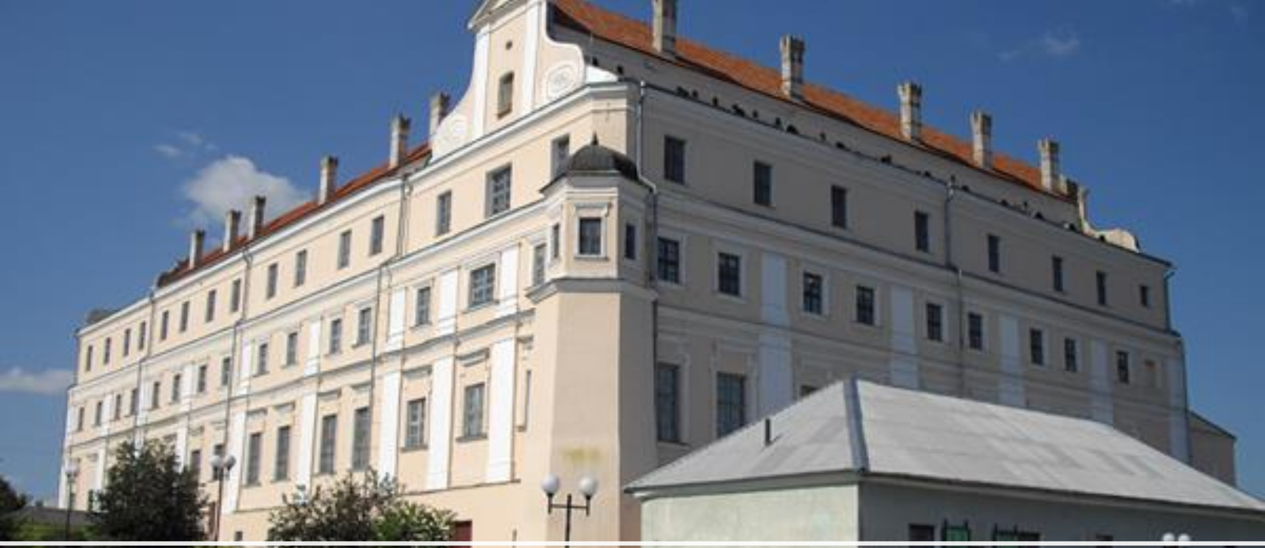
Коллегия иезуитов в Пинске