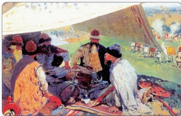
Съезд князей. ▶ Художник С. Иванов