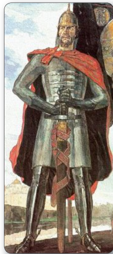
▲ Александр Невский. Художник П. Корин