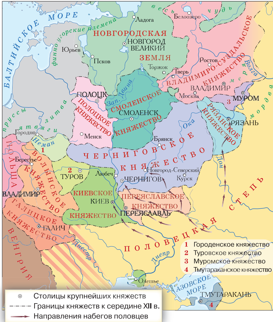
▲ Древняя Русь в период раздробленности

Терять свои владения бояре не хотели. Поэтому были заинтересованы в том, чтобы князья оставались в своих княжествах.