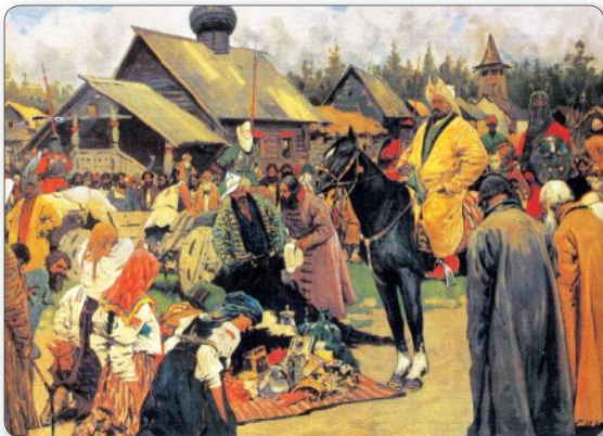
▲ Баскаки. Художник С. Иванов Баскаками называли руководителей отрядов, которые помогали собирать дань для Орды.

монголы захватили Киев. В 1241 г. монголы приступили к завоеванию соседних с Русью стран. Но сил на это у захватчиков уже не было.