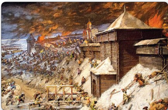
▲ Взятие монголами Рязани. Реконструкция