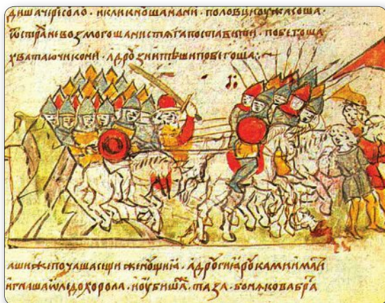
▲ Русская дружина преследует половцев. Миниатюра Радзивилловской летописи

Почти полтора столетия Русь вела напряженную борьбу с кочевниками-печенегами. От их набегов страдали незащищенные села. Не всегда их жители успевали укрыться за крепкими стенами городов. О борьбе с печенегами Владимира Красное Солнышко, его дружинников Ильи Муромца, Добрыни Никитича были сложены былины .