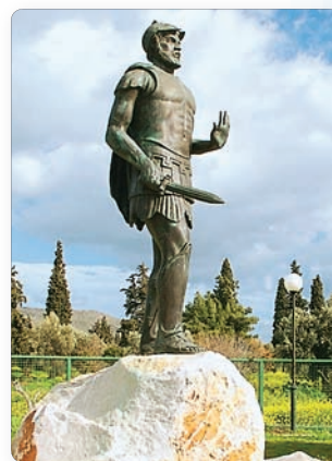
Памятник Мильтиаду на месте сражения ▶

В 490 г. до н. э. армия Дария Первого высадилась на берег Аттики севернее Афин у селения Марафон. Афинский военачальник Мильтиад построил свое войско, ослабив центр и