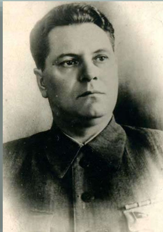
Николай Гусаров (1947-1950 гг.)