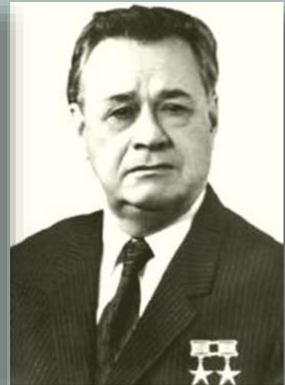
Николай Патоличев (1950-1956 гг.)