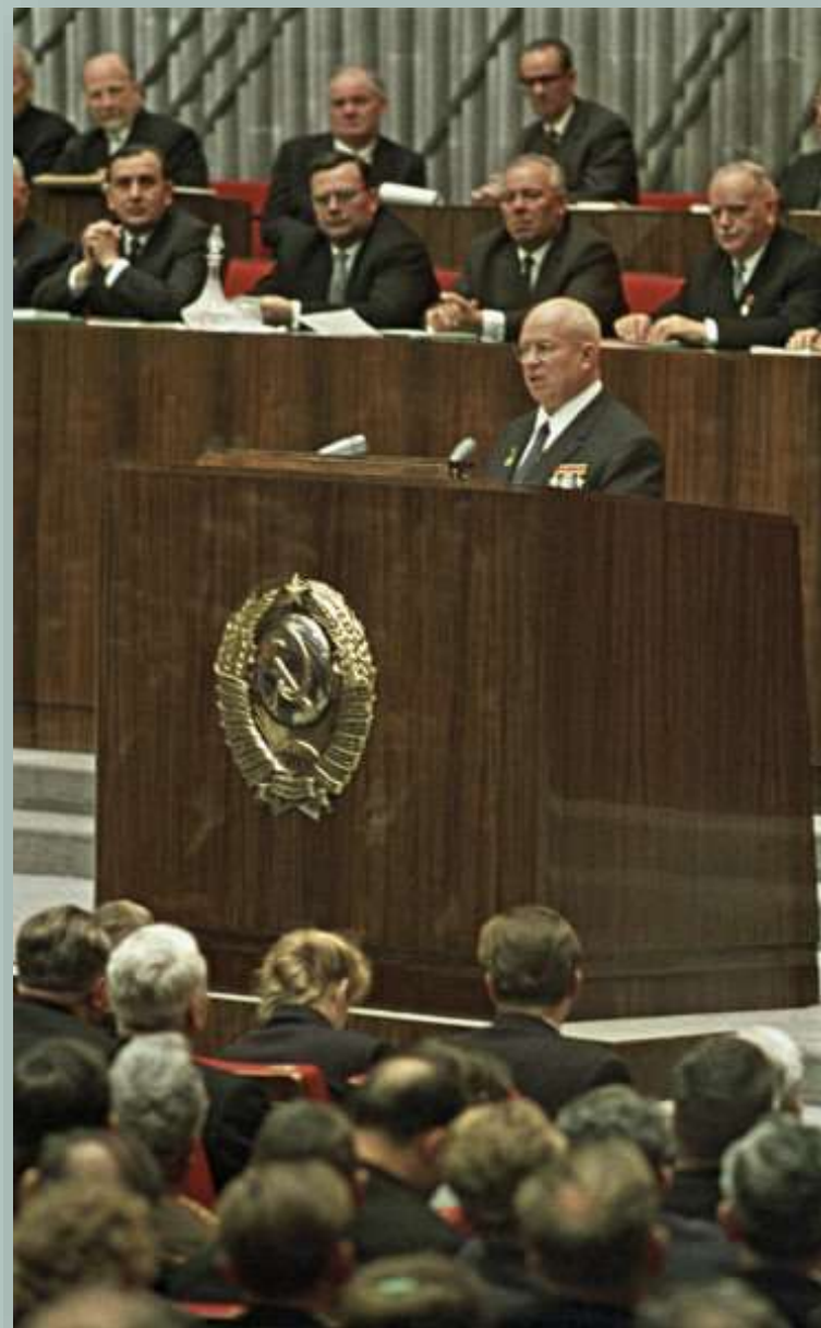
XXII съезд КПСС

Политика Н.Хрущёва, направленная на реализацию желаемых целей без учёта объективных законов развития общества, реальных обстоятельств и возможных последствий, характеризовалась как «политика волюнтаризма» . Её проявлением стало принятие на XXII съезде КПСС новой программы построения коммунистического общества до 1980 г. В годы руководства СССР Н.Хрущёвым произошло ещё большее укрепление партийного контроля и руководства всеми сферами жизни страны.