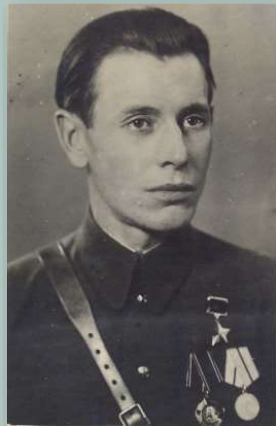
Пётр Машеров (1947-1954 гг.)