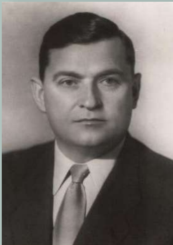
Кирилл Мазуров(1946-1947 гг.)