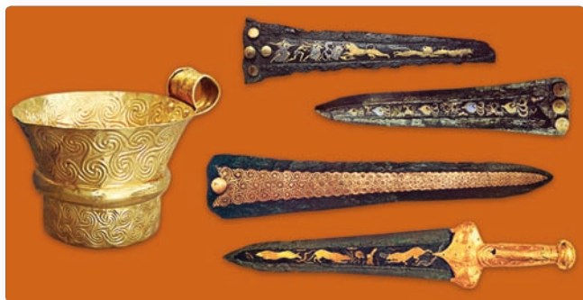
▲ Изделия из Микен:

золотая погребальная маска, чаша и инкрустированные золотом кинжалы