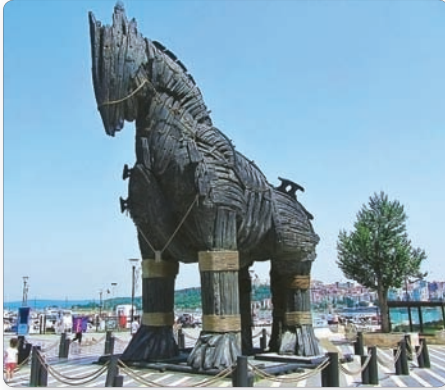
◀ Троянский конь (из кинофильма «Троя»)

Долгое время люди считали историю о Трое мифом. Только в конце XIX в. немецкий археолог-любитель Генрих Шлиман доказал, что Троя существовала. На территории современной Турции он раскопал руины легендарного древнего города.