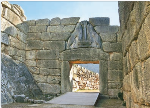
◀ Львиные ворота в Микенах

5. Дорийское завоевание. Микенская цивилизация была сильно ослаблена Троянской войной. В это время с севера Балканского полуострова на юг, в Грецию, устремились племена греков-дорийцев. Они не обладали культурой и навыками ахейцев, но были вооружены железными, а не бронзовыми мечами. Новые завоеватели захватили и разрушили почти все дворцы. Была забыта письменность,