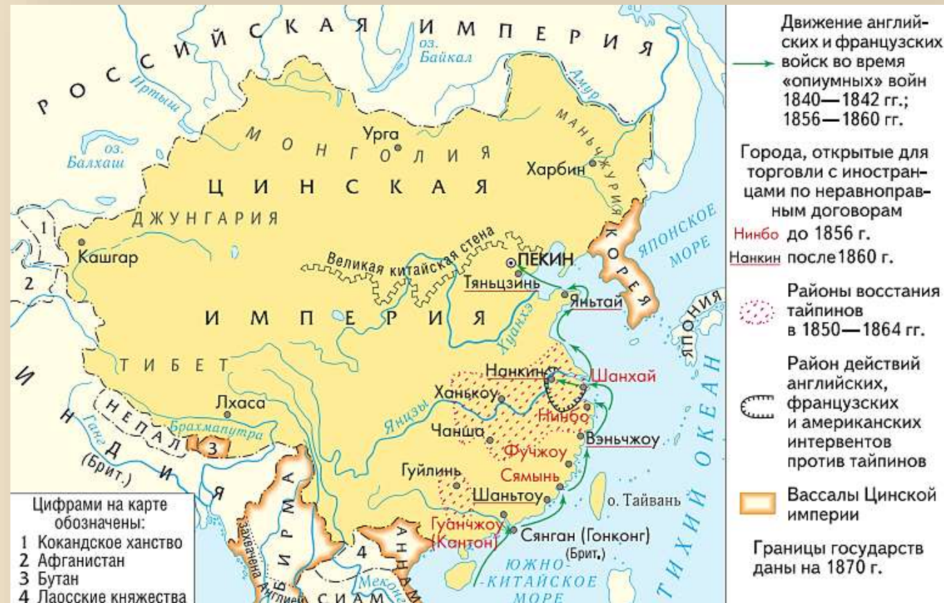
Китай в XIX в.

После поражения в «опиумной войне» 1840-1842 гг. Китай начал превращаться в полуколонию европейских держав, которые вместе с Японией навязали ему в конце XIX в. ряд неравноправных договоров.