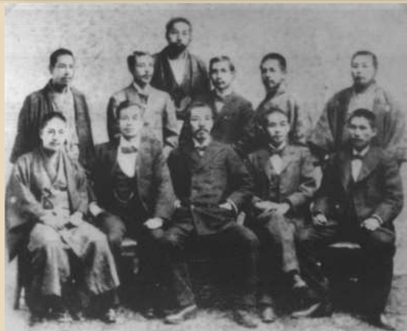
Члены «Союза возрождения Китая»

В 1870-1880-е гг. в Китае появились первые национальные предприятия, стала формироваться национальная буржуазия. Её представители, а также патриотически настроенная знать начали критиковать существующий строй. Цинская династия предприняла попытку умеренных реформ, однако они не были поддержаны большей частью феодального класса. Китайские патриоты, выступавшие за республиканскую форму правления, создали тайную революционную организацию - «Союз возрождения Китая» .