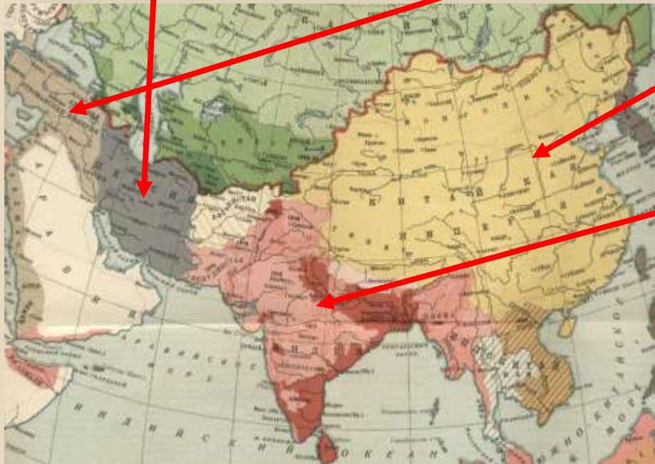
Азия в начале XX в.

подъём национально- освободительного движения в Индии в 1905- 1908 гг.