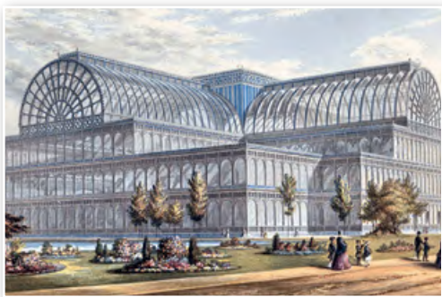
Хрустальный дворец, построенный к Всемирной промышленной выставке 1851 г. в Лондоне, стал символом промышленной революции