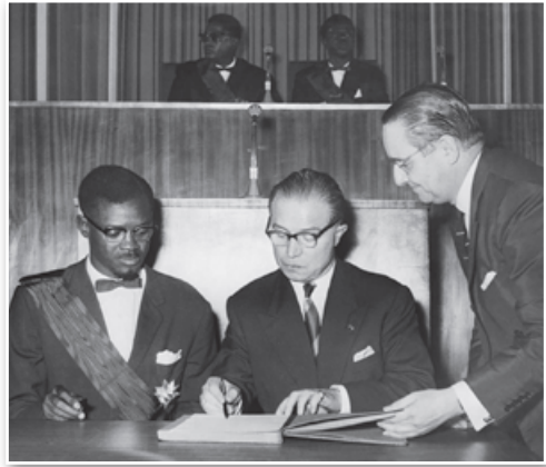
Премьер-министр Конго Патрис Лумумба и премьер-министр Бельгии Гастон Эйскен подписывают Акт о независимости. 1960 г.

Крупнейшим событием конца XX в. явились «бархатные революции» в Центральной и Восточной Европе, предопределившие новую расстановку сил на европейском континенте.