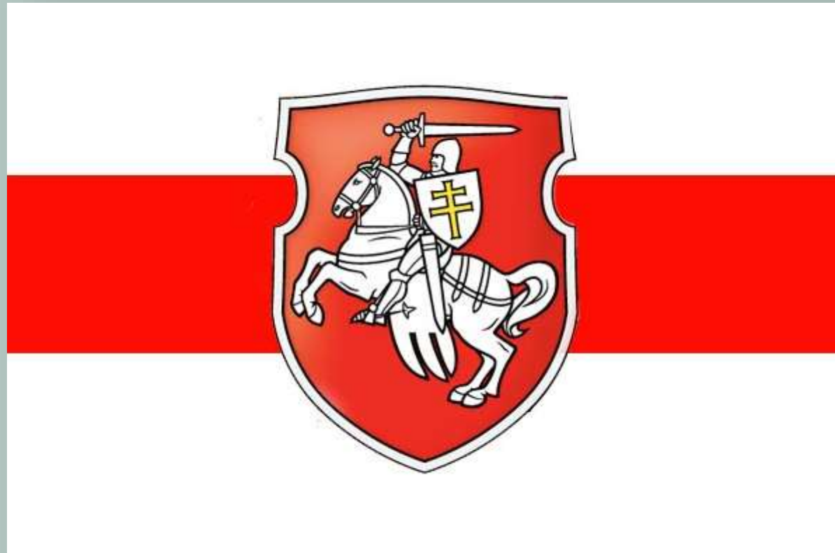
Бело-красно-белый флаг и герб «Погоня»

19 сентября 1991 г. депутаты Верховного Совета БССР приняли решение переименовать БССР в Республику Беларусь . Тогда же были утверждены новые государственные символы Республики Беларусь - бело-красно-белый флаг и герб «Погоня».