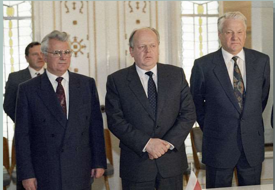
Президент Украины Леонид Кравчук, Председатель Верховного Совета Республики Беларусь Станислав Шушкевич и Президент России Борис Ельцин после подписания Соглашения о создании СНГ в Беловежской пуще