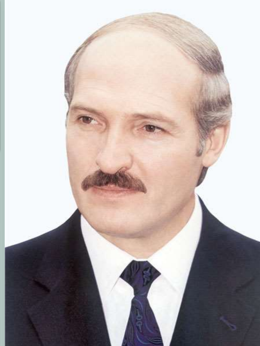
Александр Григорьевич Лукашенко

возобновление связей с бывшими республиками СССР