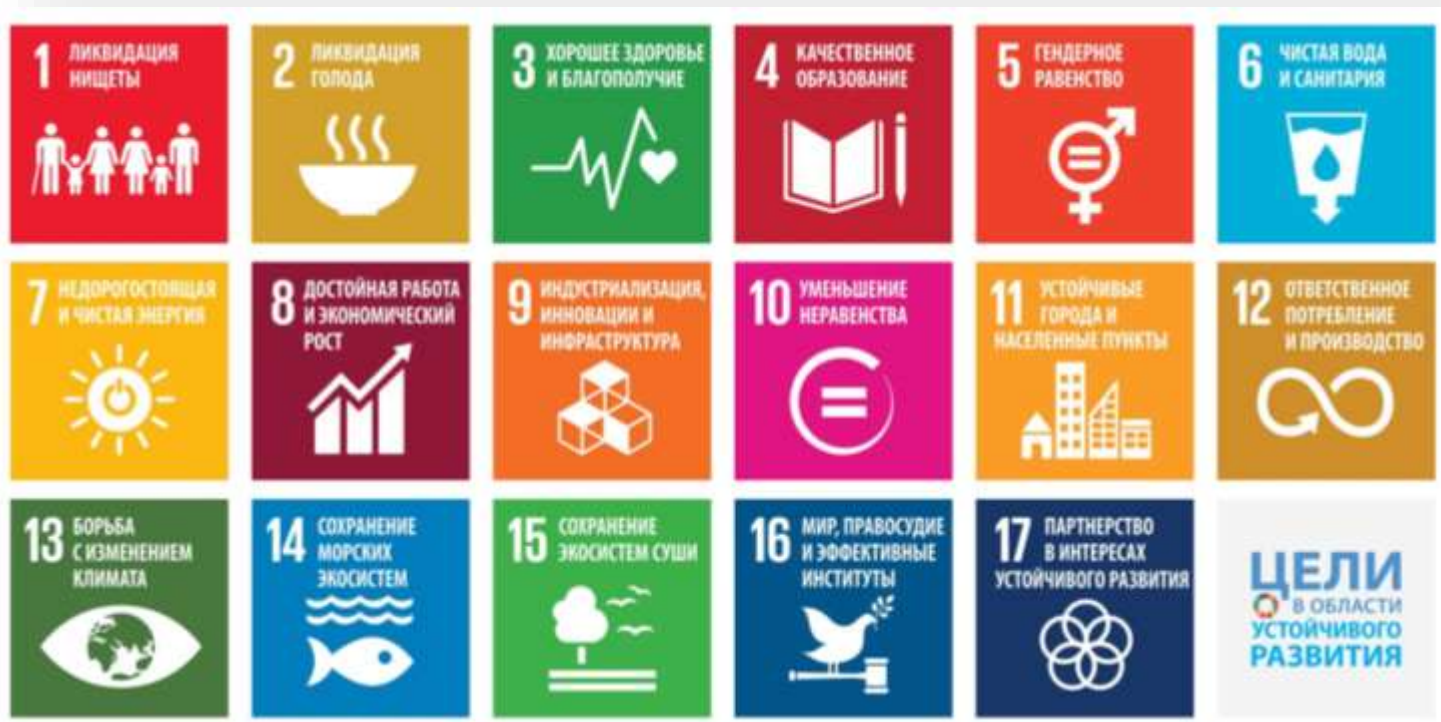
Цели в области устойчивого развития

Цели устойчивого развития - это стратегия всего человечества, направленная на то, чтобы будущему поколению передать планету в хорошем состоянии и сформировать условия для развития общества, экономики и экологии