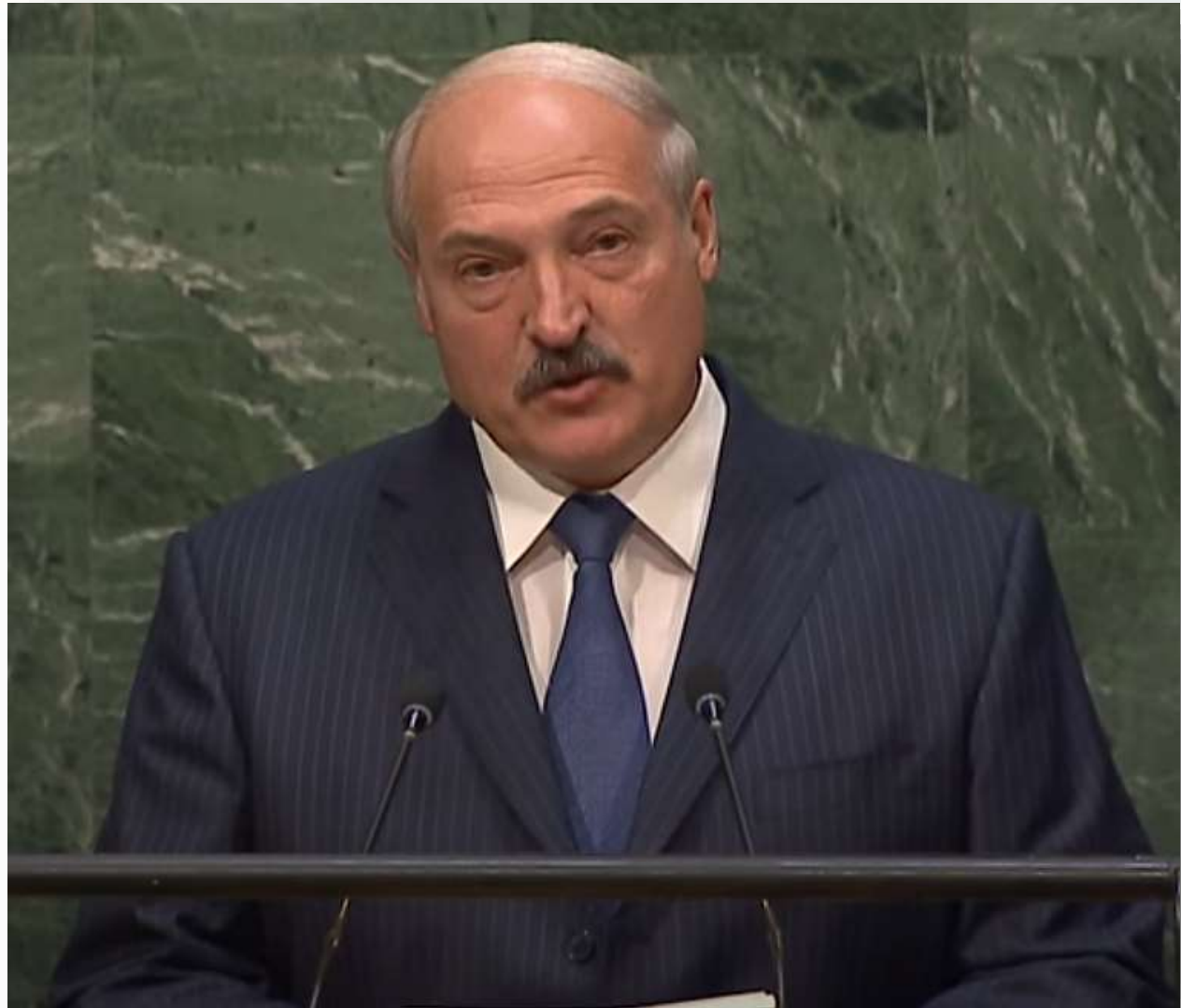
Выступление А.Г.Лукашенко на саммите ООН по устойчивому развитию. 2015 г.

(Из выступления Президента Республики Беларусь А.Г.Лукашенко на саммите ООН по устойчивому развитию. 2015 г.)