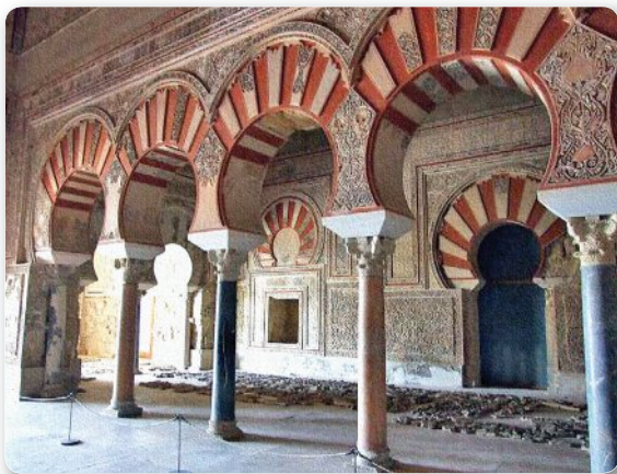
▲ Дворец арабского правителя Кордовы. Испания. X в.