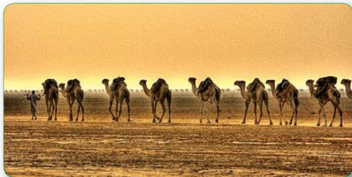
▲ Караван в пустыне

перевозили шелк, пряности, алмазы, слоновую кость и другие товары на север. Бедуины участвовали в караванной торговле. Они за плату давали караванщикам верблюдов, охраняли караваны, а то и сами были погонщиками. На торговых путях возникали крупные торговые поселения. Одним из них был город Мекка .